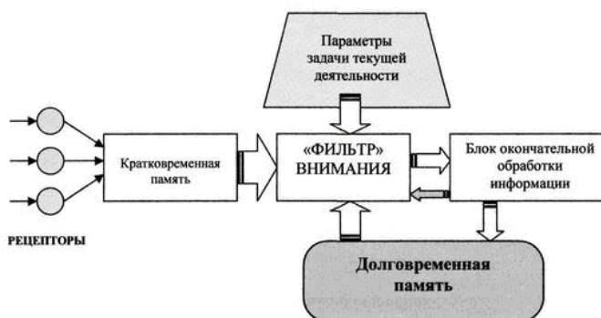
Рис. 2. Схема селективной гипотезы внимания

Профессионально-педагогическое пространство личностно-стилевых проявлений преподавателя вуза определяется следующей системой координат (рис. 3).