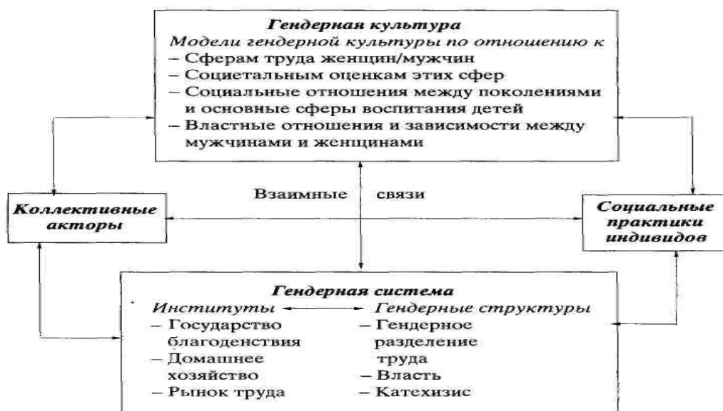
Рисунок 1. Взаимодействие культуры, институтов и социального действия в гендерном укладе (В. Pfau-Effinger, 1998).

«Гендерная культура и гендерная система есть результат конфликтов и процессов переговоров социальных акторов в предшествующий период истории, они также могут быть предметом дальнейшего изменения. Противоречия, развивающиеся на уровне гендерной культуры или в гендерной системе, конфликты, борьба и процессы переговоров между социальными акторами могут привести к культурным и социальным переменам в рамках гендерного уклада. Перемены гендерной структуры взаимосвязаны с культурными и институциональными переменами, однако только ими не определяются» [6, стр. 26-28].