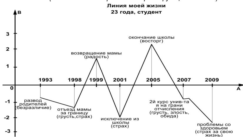
Рис. 3. Поектанта жизненного пути 1990 г. рождения

Кроме графически-семантического метода исследования жизненного пути человека мы использовали лично-мифологический подход как ретроспективный анализ вариантов жизни народных героев, взятый из группового бессознательного, образы жизни из мифов о