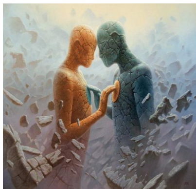
Рис.1. Встреча объекта любви