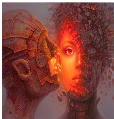
Рис. 2 Установление близости