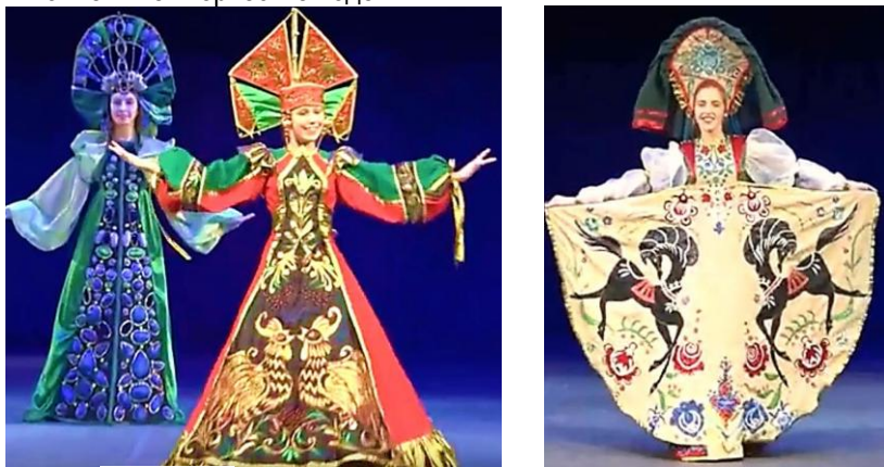
Рисунок 1 – «Многогранность народного костюма Сибири» Образцовый детский коллектив «Театр костюма». Ответственные: З.М. Первова, О.А. Первова, Первомайский район Томской области, МАОУ Улу-Юльская СОШ. Костюмы демонстрируют обучающиеся 7-11 классов.

На заседании секции 2 «Этнокультурное образование в сельской поликультурной среде (обучающиеся)» были представлены учащимися, начиная с третьего – по одиннадцатый классы, научно обоснованные доклады, авторские проекты и затейливые, мастерски выполненные творческие поделки.