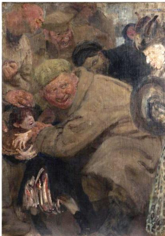
Большевики. Репин. 1918. Константиновский дворец, Санкт-Петербург.