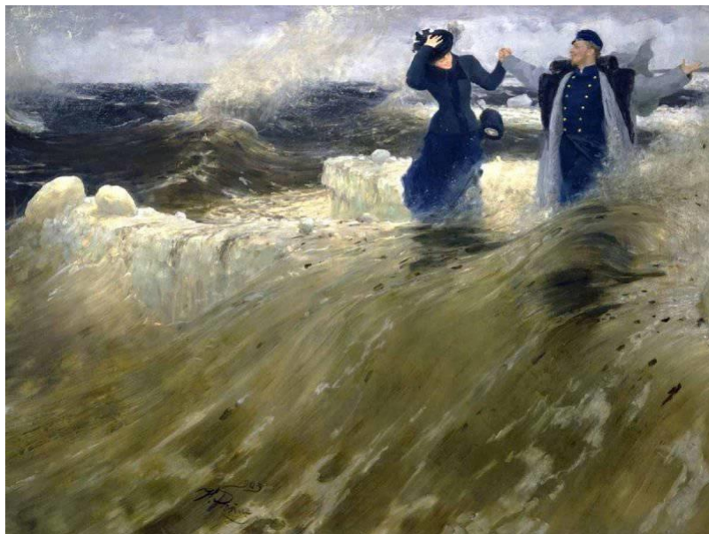
Какой простор! Репин. 1903.

Государственный Русский Музей, Санкт Петербург.