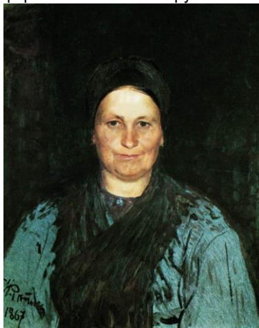
Портрет матери. Репин. 1867. Национальная галерея (Прага).

Одним из выдающихся представителей своего времени был художник Илья Ефимович Репин. Он рос в семье, где присутствовал и воспитывался интерес к произведениям искусства и литературы. Общение с близкими людьми, начиная с детства, способствовало развитию у будущего художника чувства сопереживания к окружающим, которое впоследствии нашло отражение в его произведениях. Ощущая теплоту и любовь своих родных, художник уже вначале своего творчества пишет портреты ближайшего круга своей семьи.