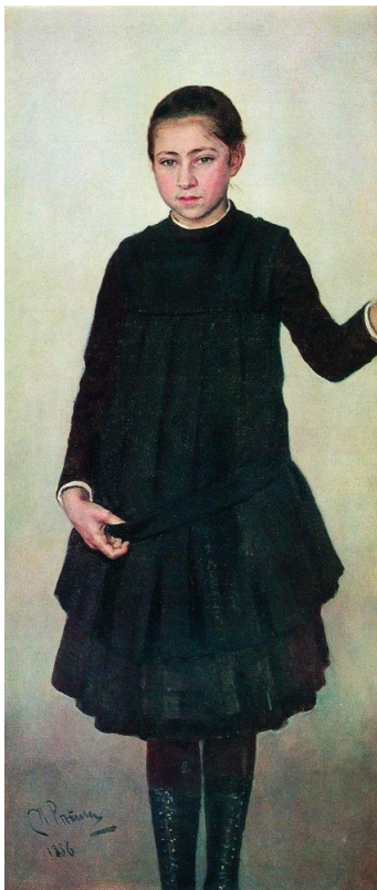
Портрет В.И. Репиной. Репин. 1886. Государственный Русский музей

появляется новый взгляд на воспитание и обучение ребёнка. Начиная с середины 19 века, в крупных городах России открываются женские гимназии. На другом портрете художника та же девочка двумя годами позже в гимназическом платье, повзрослевшая, уже выглядит сосредоточенной и серьезной, выполняющей роль ученицы.