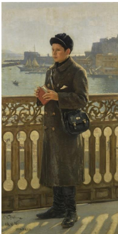
Портрет Юрия Репина на фоне Неаполитанского залива. 1894. Частная коллекция, Нью-Йорк.

Социальному неравенству в обществе посвящены многие картины Ильи Репина. Эта тема присутствует и при изображении детства. Так на картине «Нищая девочка-рыбачка» показано отношение к детству в среде обездоленных людей. Художник изобразил девочку со страдающим опущенным взглядом, натруженными как у взрослой руками. Дырявая одежда в заплатках дополняет грустную картину на фоне нежного летнего пейзажа. Девочка, лишенная детства, вызывает чувство сопереживания к её тяжёлой доле и контрастирует с