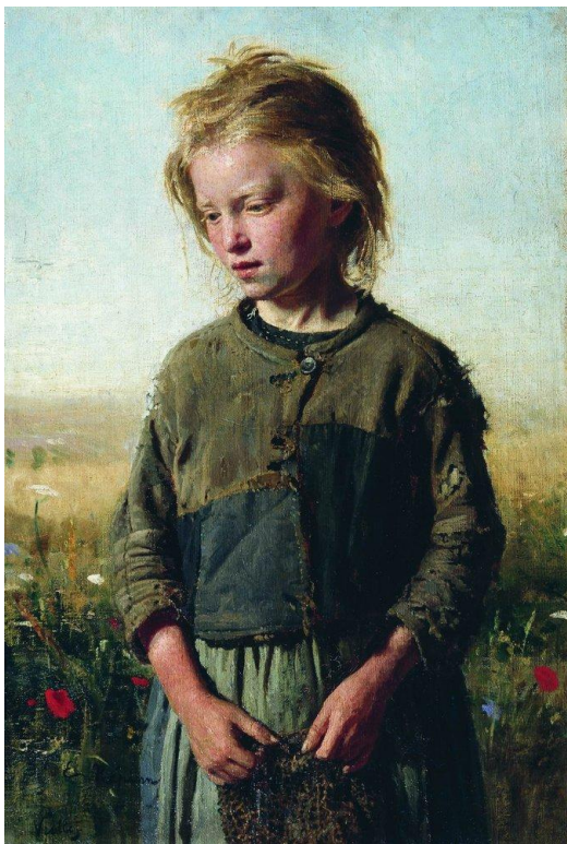
Нищая девочка-рыбачка. Репин. 1874. ГТГ.

В отличие от Арьеса, который считал, что изменения отношения к детству – это следствие изменения состояния нравов в обществе, детский психолог Д.Б. Эльконин, опираясь на изучения этнографических материалов, отмечал, что детство возникает тогда, когда усложнение орудий труда не позволяет ребёнку рано овладеть ими и включение детей в производительный труд взрослых отодвигается во времени [4]. Картина Репина показывает, что при рассмотрении статуса детства необходимо учитывать положение родителей в социальной структуре общества.