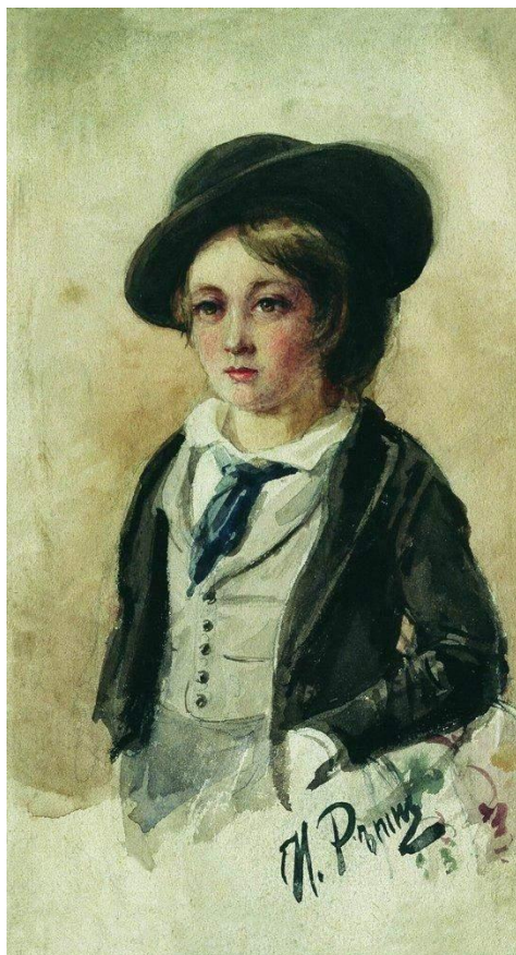
Портрет мальчика. Репин. 1867. Таганрогский художественный музей.

Напряженные социальные отношения в российском обществе в начале 20-го века нашли отражения в картинах художника. Так своих взрослых детей он изображает на картине «Какой простор!». Жажда жизни, свойственная молодости, видна в позах молодых людей. Буря уже надвигается, но они радуются её приходу как орёл у М. Горького в его произведении «Буревестник», ещё не вполне понимая какие разрушения и беды она может принести.