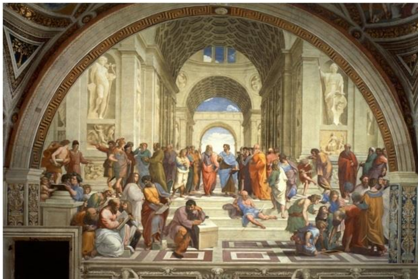
Рисунок 1. Рафаэль Санти. Афинская школа 1511 (Ватикан).