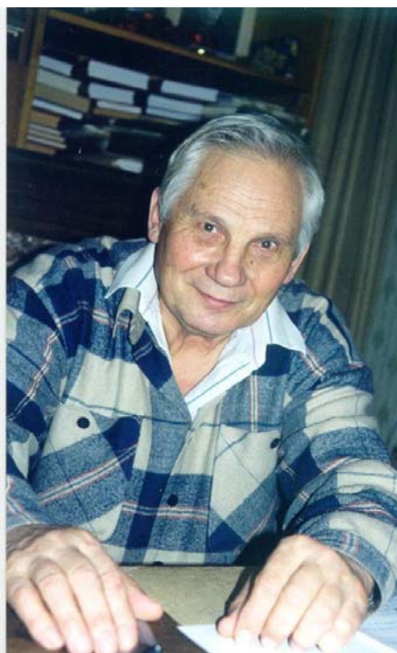
Рис. 3. Сергей Павлович Курдюмов (1928–2004) Один из основоположников синергетики в России