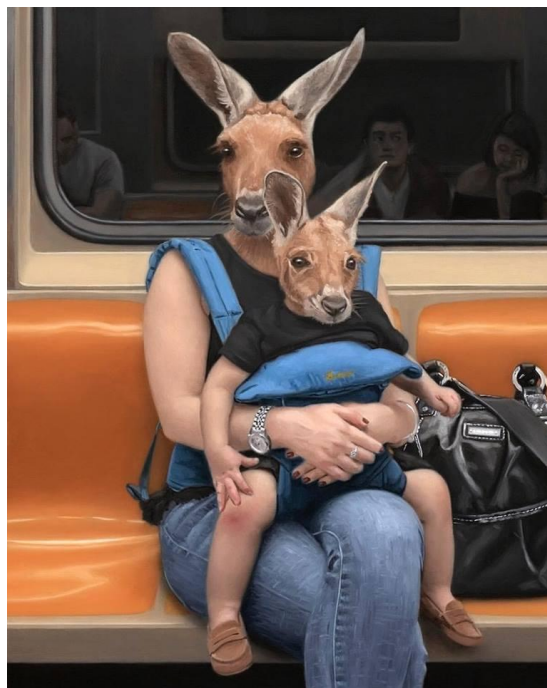
М. Грабельски «Varick Street»

навыки рисования во Флоренции и Хьюстоне. Художник ознакомился с техникой великих французских мастеров на базе академического рисунка и живописи. По признанию самого художника, ему с детства нравились животные и мифологические существа, поэтому он решает совместить реальность и вымысел в своей серии картин людей с головами зверей, мирно сидящих в вагоне метро. Его коллекция работ пополняется и по сей день. В ноябре он открыл свою выставку в галерее Нью-Йорка. Известно, что Мэттью Грабельски фотографирует вагоны метро ранним утром или поздним вечером, когда они еще