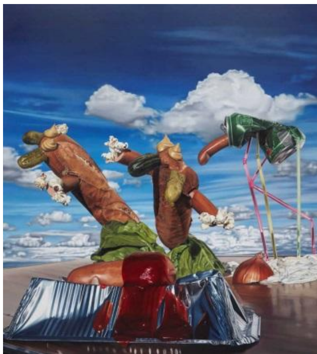
Т. Рабус (без названия)

В нескольких картинах этого художника можно увидеть ассоциации с шедеврами уже упомянуто Сальвадора Дали, но они созданы в другом жанре. Изображение человека в виде сосиски в кетчупе звучит дерзким вызовом обществу.