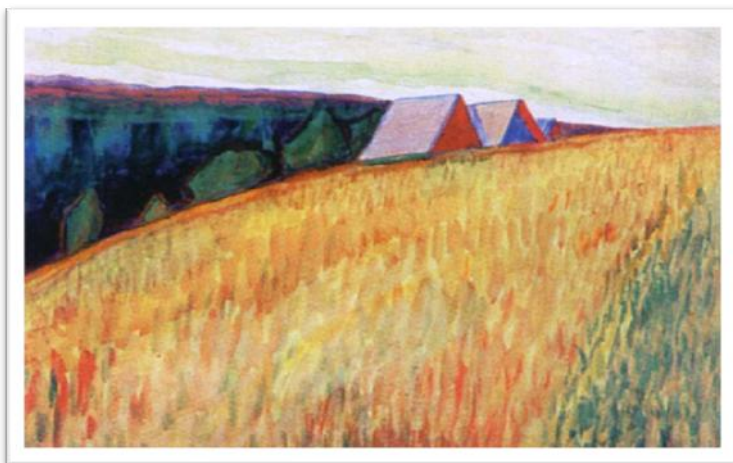
Михаил Матюшин «Пейзаж со всех сторон. Сиверская» 1924 г.

Проведенное краткое исследование позволило в ходе анализа сформулировать ряд основных выводов о взглядах М.В. Матюшина, о влиянии его теории периода XX века на современников. Очевидно, что Матюшин принадлежал к художникам-новаторам, до него никто не рассматривал эти вопросы, и поэтому его теория естественно подвергалась критике. Но, не смотря на это, его идея «расширенного смотрения», решение увеличения композиционного пространства, гармоничное сочетание цвето-тоновых отношений нашли своих последователей.