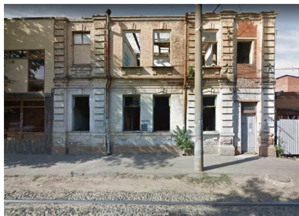
Рис. 2. ул. Горького, 117