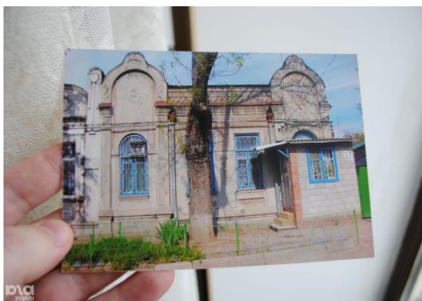
Рис. 1. Особняк на улице Фрунзе, 63

4. Поверхности требуют переоценки / Коммерсантъ. Краснодар. URL: https://www.kommersant.ru/doc/3502352 (дата обращения: 05.04.2018).