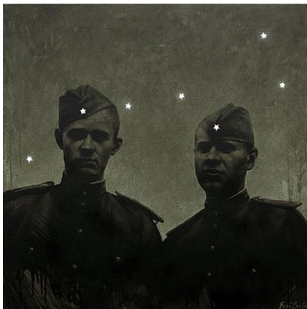
«Ночь. Большая медведица»

В работе «Ночь. Большая медведица» в живых остаются только два героя. Очень интересно, что это полотно значительно отличается от остальных. Мы видим, что художник использует приемы, которые в других картинах не прослеживаются. Ковш большой медведицы наклонен, из-за чего линия приобретает более ломаный вид, чем раньше. Также Волигамси совершенно иначе изображает созвездие: вместо сигаретных огоньков мы, наконец, видим настоящие звезды, но самой главной особенностью является изменение их расположения в пространстве. Они поднимаются выше и занимают место не у рта, как раньше, а на беретах солдат. Художник таким способом еще больше старается продемонстрировать героизм ребят, отдавших свои жизни ради других.