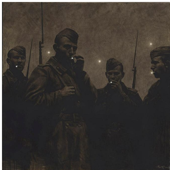
«Сумерки. Большая медведица»

Следующая картина называется «Сумерки. Большая медведица». В колорите и технике ничего не меняется, все так же сохраняется монохромность и темные тона. Но в композиции мы можем наблюдать некоторые отличия. Во-первых, на картине изображено меньше людей. Четверо солдат стоят с сигаретами, но огоньков остается семь, как и в предыдущей работе. Мы не знаем, куда пропали герои, но первая мысль, которая приходит в голову зрителя, что они погибли в бою, а эти огоньки символизируют души погибших солдат. Во-вторых, у людей за спиной появляется оружие, что вызывает совершенно другие эмоции: пропадает то спокойствие и умиротворение, которое ощущалось на предыдущем полотне, вместо этого чувствуется напряжение и готовность к борьбе за жизнь и свободу своего народа.