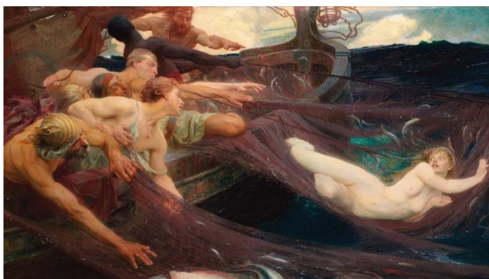
Г. Дрейпер «Морская дева»

Изображение содержит множество контрастов: море и воздух, мужское и женское, темное и светлое. Эти контрасты усиливаются цветами, используемыми Дрейпером. Темнота моря и погоды противопоставляются бледности сирен. Эта работа была сделана позже в карьере Дрейпера, резко контрастируя с более ранней его картиной «Морская дева» (1894), которая демонстрирует моряков как источник агрессии.