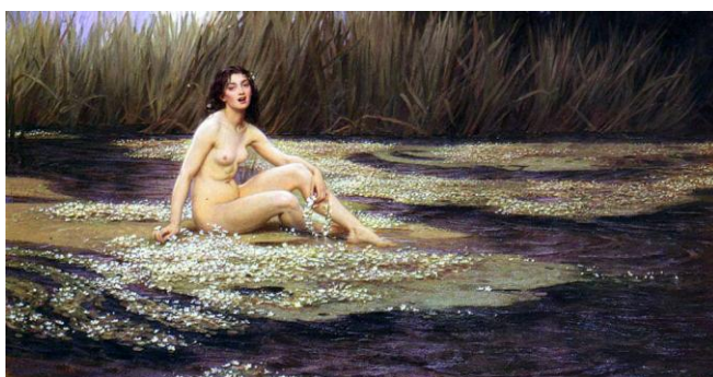
Г. Дрейпер «Речная нимфа»

Первое использование мотива женского желания было в картине «Речная нимфа» (1908). Ранние наброски этой картины изображают нимфу, соблазняющую молодого человека. В законченном варианте картины нимфа направляет свое внимание на зрителя. Внутреннее беспокойство девушки вызывает психологический дискомфорт, при просмотре чувствуется некое напряжение.