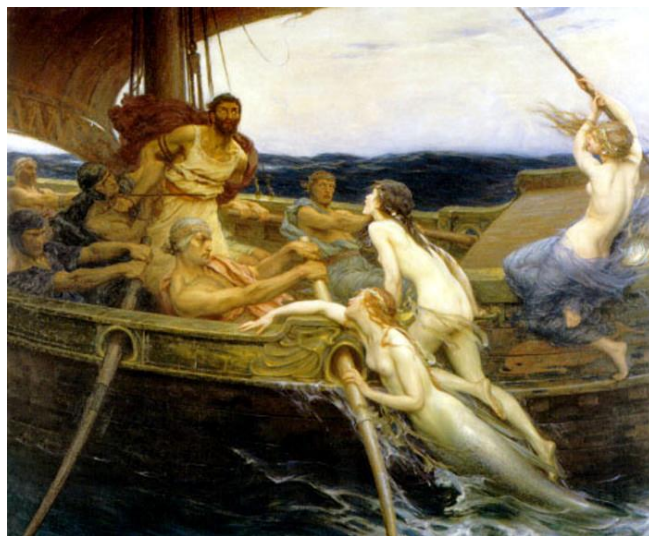
Г. Дрейпер «Улисс и сирены»

– созданий, похожих на птиц, но с женскими головами. Они завлекали мореходов своими чудесными песнями и губили их в морской пучине. Улисс изображается привязанным к корабельной мачте, с тоской смотрящим на мыс, где лежат