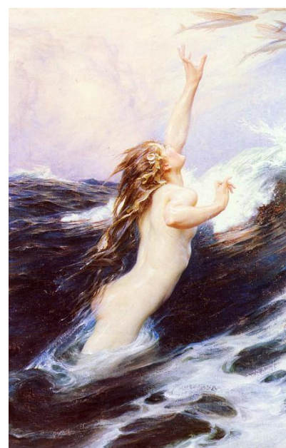
Г. Дрейпер «Летучая рыба»

Первое использование мотива женского желания было в картине «Речная нимфа» (1908). Ранние наброски этой картины изображают нимфу, соблазняющую молодого человека. В законченном варианте картины нимфа направляет свое внимание на зрителя. Внутреннее беспокойство девушки вызывает психологический дискомфорт, при просмотре чувствуется некое напряжение.