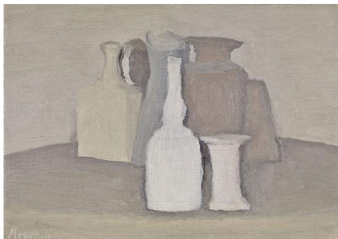
Джорджо Моранди Natura Morta 1948 г.

Рассматривая творчество Джорджо Моранди 30–40 годов, можно заметить, как он повторяет те же предметы, что и в натюрморте 20-х годов, но чаще он обращается к изображению вытянутых предметов, особенно бутылок, также меняется колорит, теперь в работах доминируют светлые цвета. Анализ данного периода творчества Джорджо Моранди можно произвести по натюрморту с кувшинами.