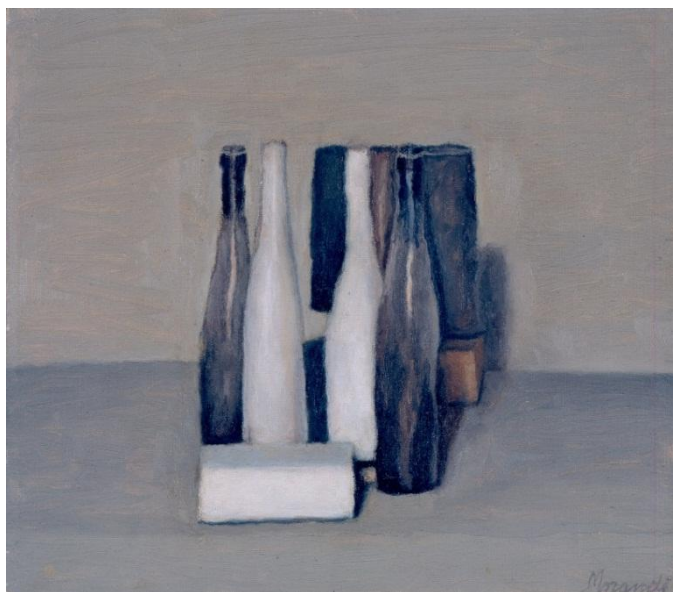
Джорджо Моранди Natura Morta. 1957 г.

Натюрморт с бутылками 1957 года выделяется тем, что художник передает ощущение фактуры, от этого в работе много бликов и рефлексов, она глубже и живее, чем эксперименты Моранди прошлых лет. Художник использует иную живописную манеру, он выбирает более аккуратную и тонкую