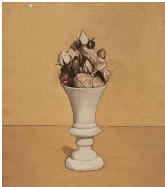
Джорджо Моранди Flowers. 1918 г.

отнести к ранним работам, так как написан он был в 1916 году. С этих первых экспериментов художника начинается натюрмортный мотив и продолжается на протяжении всего его творчества. В данном полотне еще заметно влияние метафизической живописи: художник использует светотеневую моделировку, заметны гладкие контуры, а интересная сложная форма вазочки и засохшие цветы в ней, словно несут какой-то смысл, на самом деле у картины даже отсутствует название. Эта работа – один из первых известных опытов художника в натюрморте, и Моранди уже тут показывает себя мастером композиции. Цвета монохромны и находятся в одной палитре, но отличаются степенью яркости, тем не менее, в отличие от последующих натюрмортов, здесь присутствуют тени