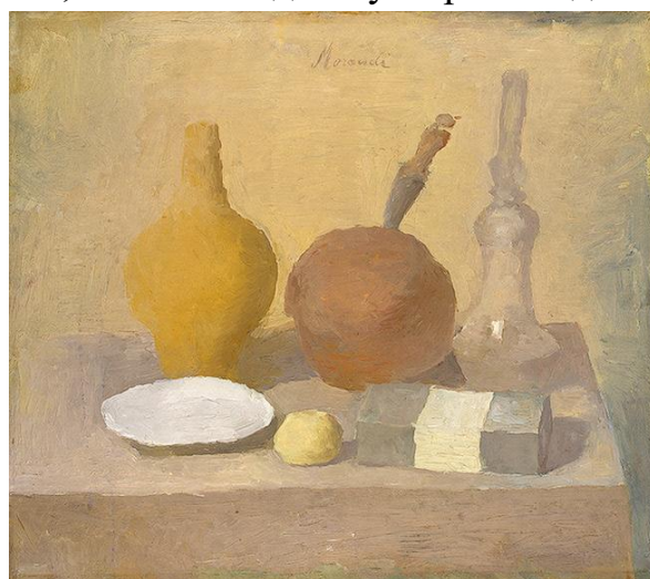
Джорджо Моранди Still Life. 1925 г.