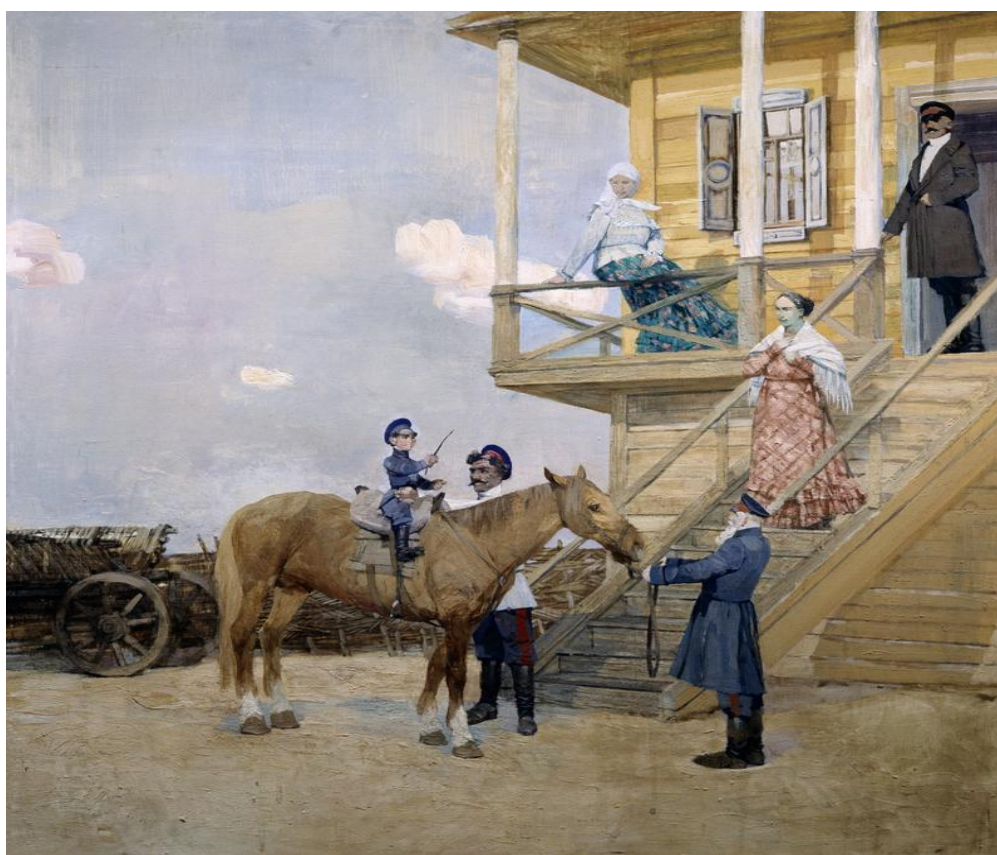
Рисунок 6. «Постриг», 1999.