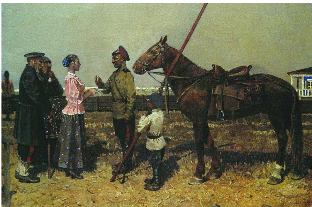
Рисунок 4. «Проводы», 2003.