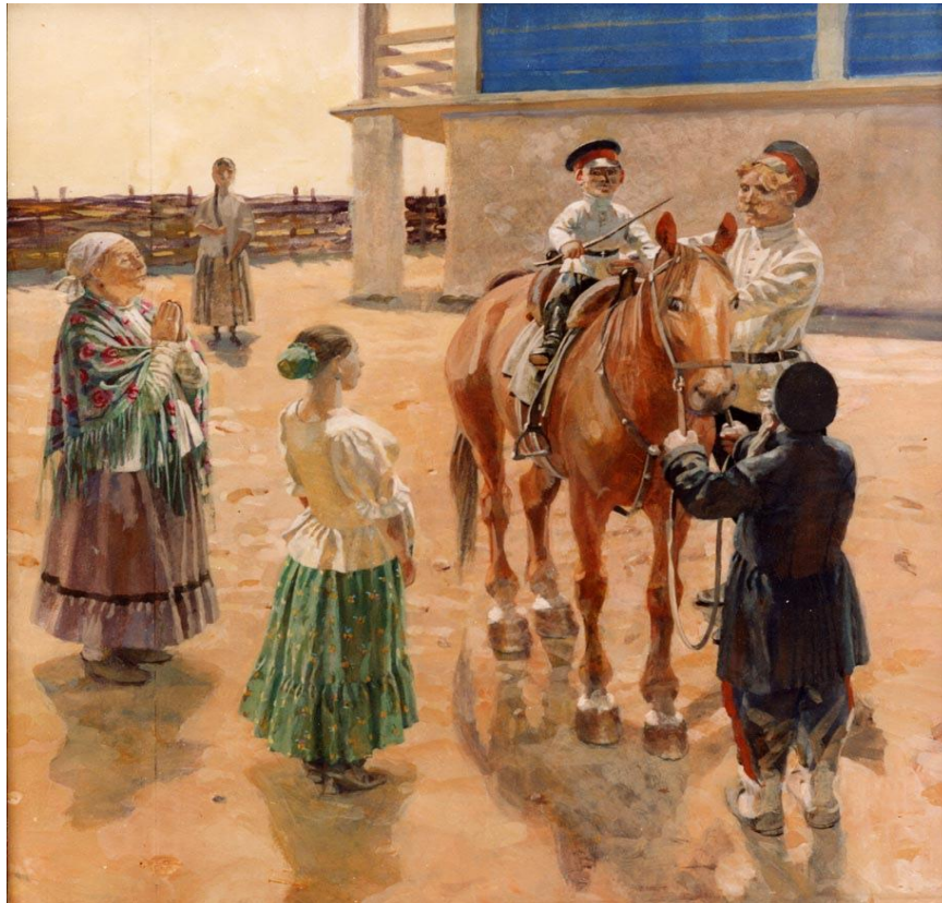
Рисунок 7. «Постриги», 2000.