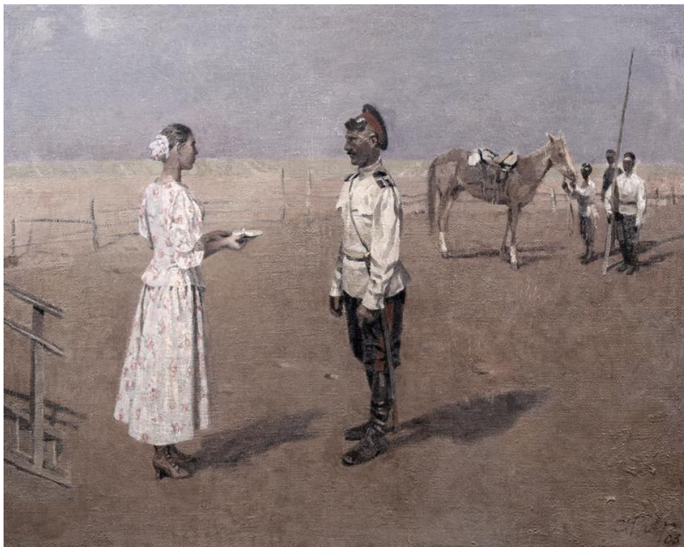
Рисунок 3. «Казачьи проводы. Стременная», 1999.