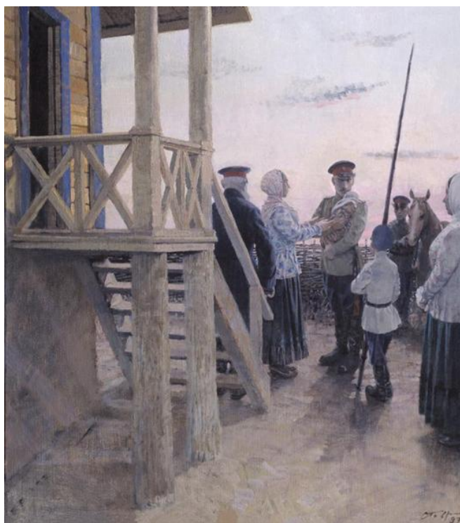
Рисунок 1. «Проводы», 1997.