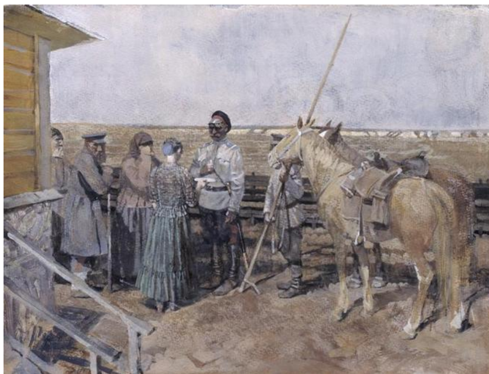
Рисунок 2. «Проводы», 1997.