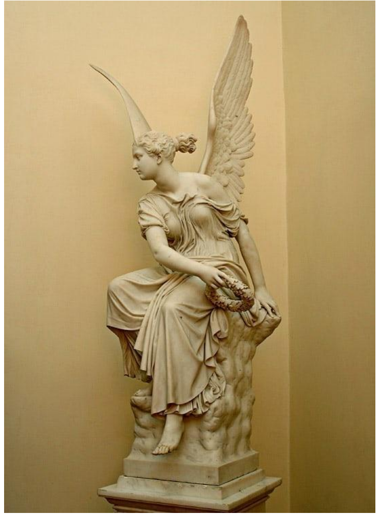
Рисунок 4. Виктория работы Христиана Рауха. Эрмитаж (1837/1838 г.)