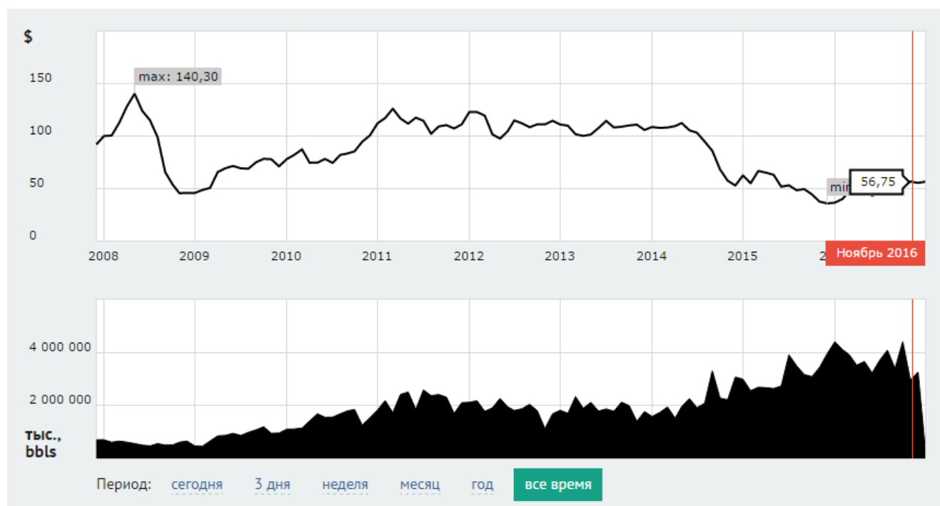
Рис.2 График курса цен на нефть марки Brent в период 2008-2016 гг. 4

В ноябре 2016 года стоимость барреля нефти составляла 56,75 долл.США, цена в сравнении с 2014 годом относительно не велика, но количество нефти реализованной в 2016 году превышает показатели 2014 года на 800 - 1 100 млн.тонн и составляет приблизительно 2 900 - 3 100 млн.тонн. Опираясь на данные таможенной статистики, в 2016 году с территории России было экспортировано нефти на сумму всего 66,4 млрд.долл.США.