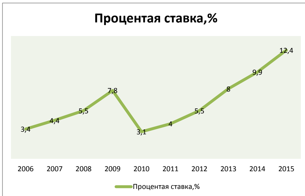
Рисунок -3 Изменение процентной ставки за период 2006-20015 г.г.

факторов, среди которых наиболее значимыми являются: изменение процентной ставки, а также изменения цен на нефть на товарной бирже.