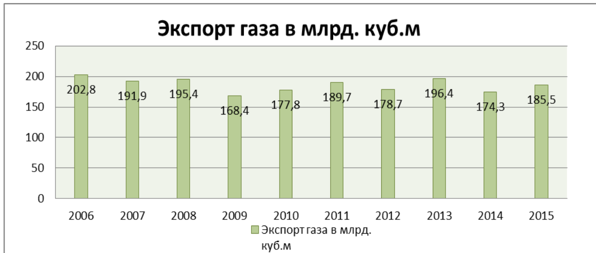
Рисунок – 1 Экспорт газа.

Если обратиться к статистическим данным, то можно увидеть, значительный спад по показателю объема экспорта газа в указанный период.