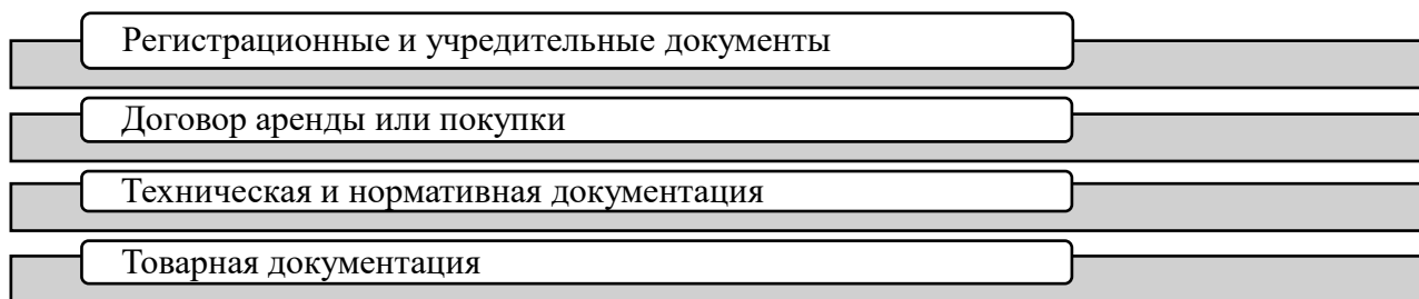
Рис.1 Перечень документов для сертификационного центра

Договора аренды или договора покупки, в том смысле, что эти договора касаются сооружений, зданий или помещений, в которых производится лакокрасочная продукция, или находится склад товаров лакокрасочной продукции.