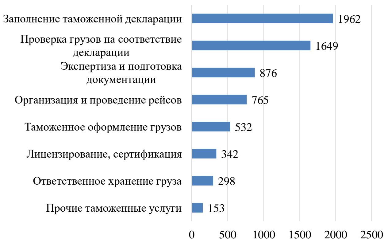
Рис. 2 Количество предприятий, оказывающих логистические услуги в таможенной сфере по состоянию на 01.10.2017 года (по данным проекта orgpage.ru и таможенного бизнес-каталога customsexpert.ru )

Очевидно, что наиболее востребованными услугами являются заполнение таможенной декларации и проверка грузов на соответствие таможенной декларации. Необходимо отметить, что помимо указанных услуг, крупные таможенные посредники предлагают узкоспециализированные услуги, например, такие как сопровождение при гарантийном ремонте и техническом обслуживании импортной техники и оборудования, при производстве изделий из импортных материалов и так далее.