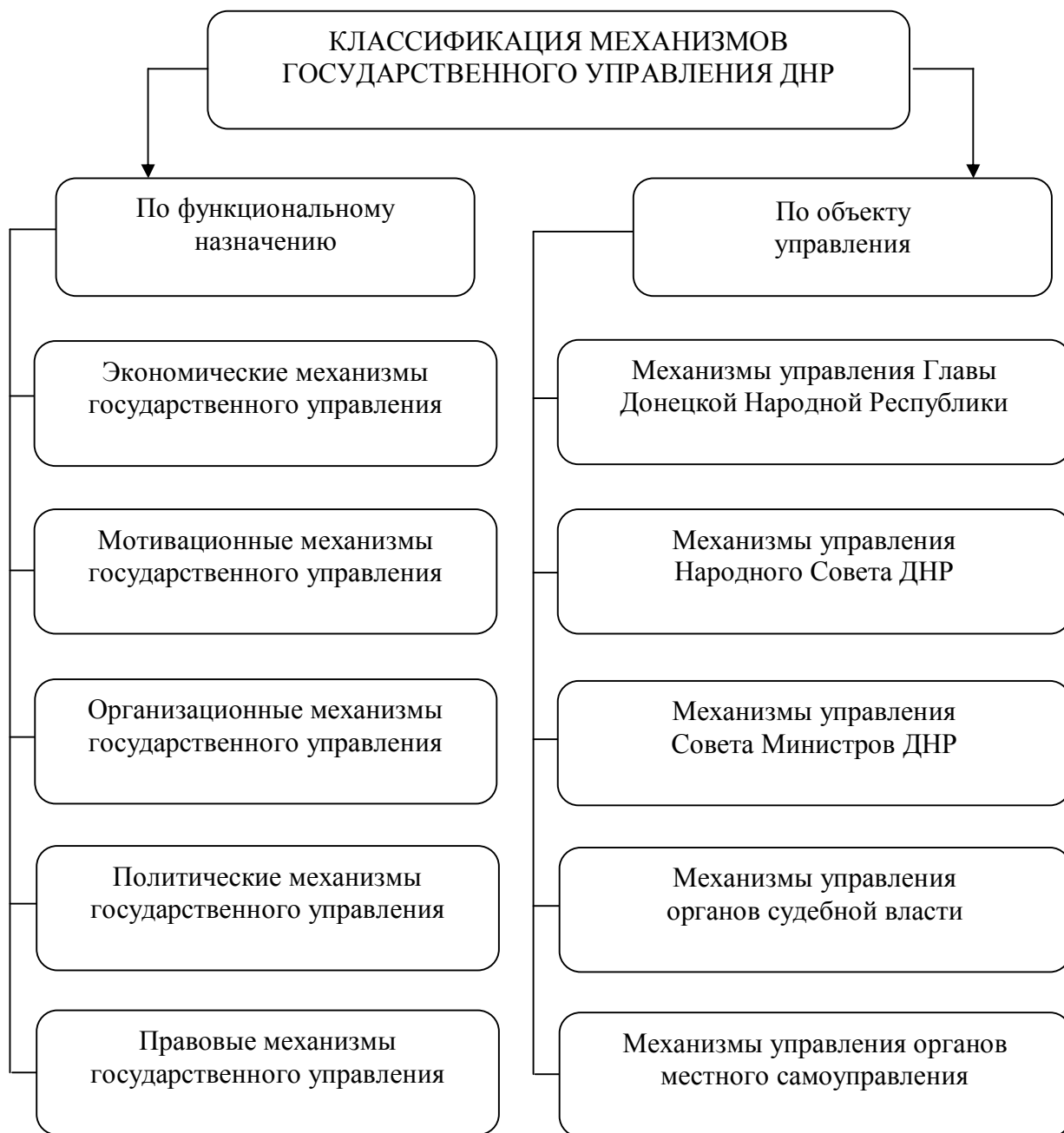
Рис. 3. Классификация механизмов государственного управления ДНР

Анализ научных исследований относительно содержательного наполнения понятия «механизм государственного управления» позволил определить механизм государственного управления как сложную систему, предназначенную для достижения поставленных целей, которая имеет определённую структуру, методы, рычаги, инструменты воздействия на объект управления с соответствующим правовым, нормативным и информационным обеспечением.