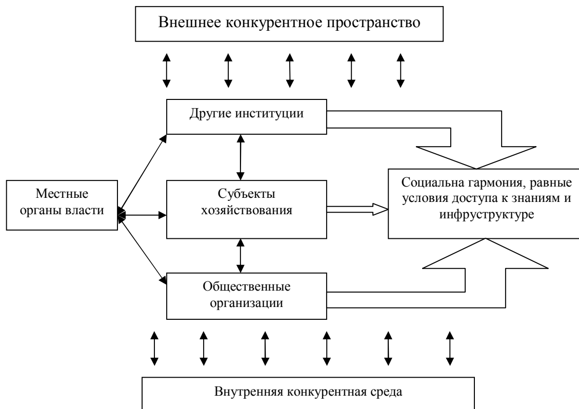
Рис. 2. Система управления пространственным развитием региональных систем

В результате авторское понимание сущности пространственно-экономической трансформации представлено на рис. 3.