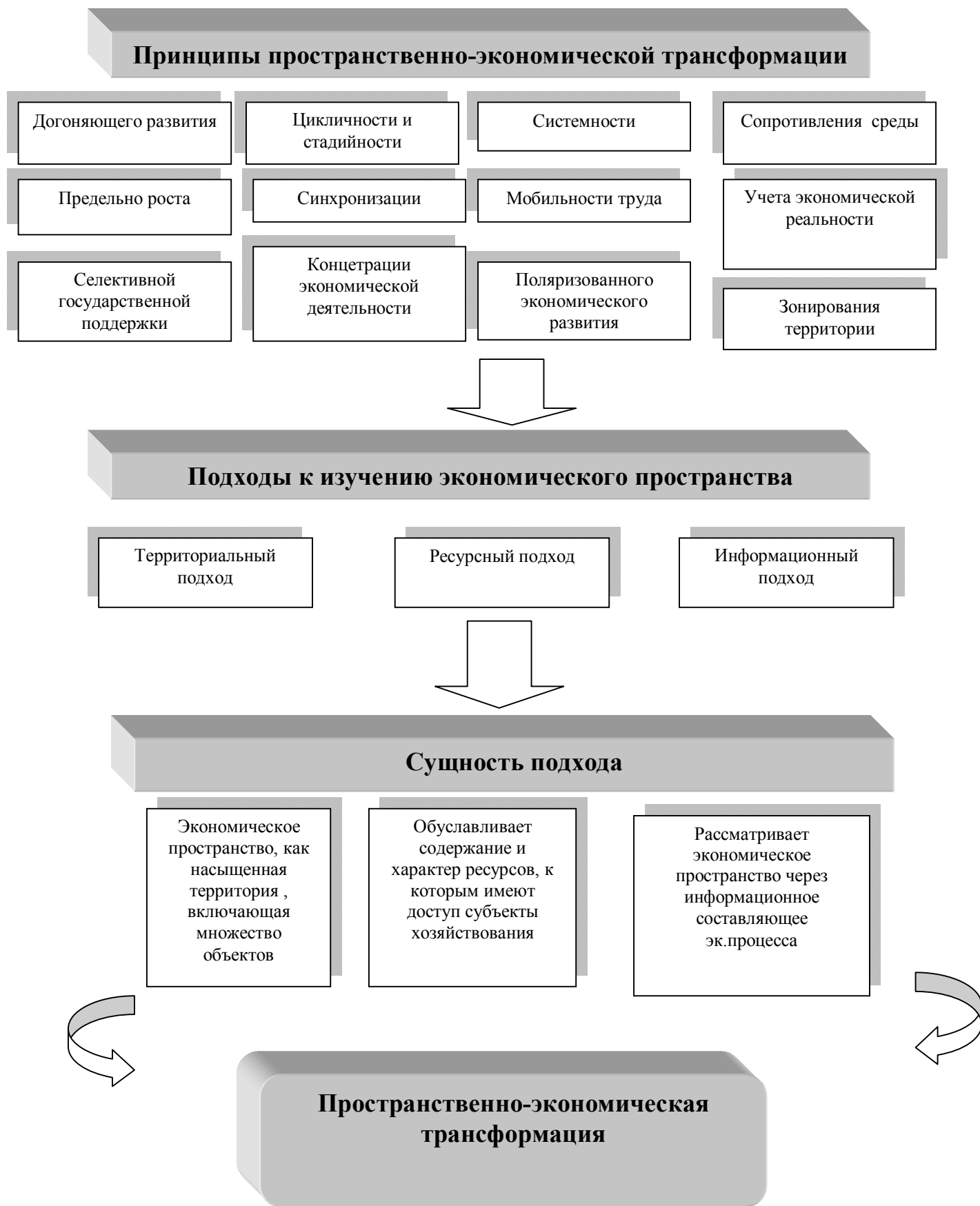
Рис. 3. Авторское понимание сущности понятия пространственно-экономическая трансформация

пространственно-экономических трансформаций.