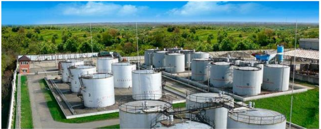
Рисунок 3. Резервуарный парк нефтебазы

Стальные вертикальные цилиндрические резервуары имеют следующее оборудование: дыхательные и предохранительные клапаны; стационарные пробоотборники; огневые предохранители, приборы контроля и сигнализации; противопожарное оборудование; сифонный водоспускной кран, вентиляционные патрубки; приемораздаточные патрубки, хлопуши; люки-лазы, световые и измерительные; диски-отражатели.