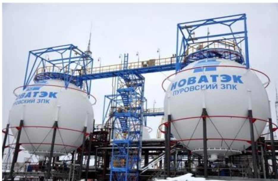
Рисунок 1. Варианты опирания сферического газгольдера (экваториальное и кольцевое).

Материалы и методы исследования (для экспериментального исследования) или ведущий подход (для теоретического исследования) ( Materials and Methods )