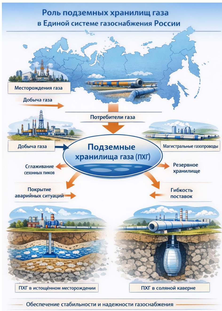
Рисунок 1. Схема роли подземных хранилищ газа в структуре Единой системы газоснабжения Росс