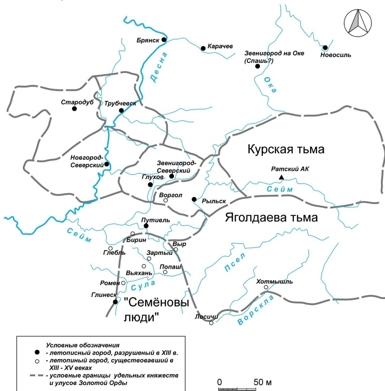
Рис. 1. Карта расположения летописных городов XII-XV вв.

мнение в существовании Звенигорода. Она опубликовала фрагмент работы Ю. Пузыны, где назвала Звенигород-Северский «несуществующим городом», найденным в работах Ю. Вольфа [13, с. 102].