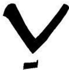
Рис. 3. Бортное знамя «куцер да знамя полтретья рубежа». Графическая реконструкция автора.

Бортным знаменем Андреевского поместья был «куцер да пол-третья рубежа». В тексте не указано как именно ориентировано бортное знамя, но исходя из традиционного начертания «куцера» можно предположить, что он расположен «рогами вверх». Расположение знака «рубеж» так же не уточнено. В тексте указано, что его длина составляла половину трети (15%) от полного начертания бортного знака. Можно предположить, что бортное знамя выглядело следующим образом – куцер рогами вверх и рубеж внизу (рис. 3). Простота изображения бортного знамени говорит о его древности. Обычно при смене владельца к первоначальной фигуре добавлялась еще одна и, таким образом, получался геометрически сложный знак [4, с. 158, рис. 2].