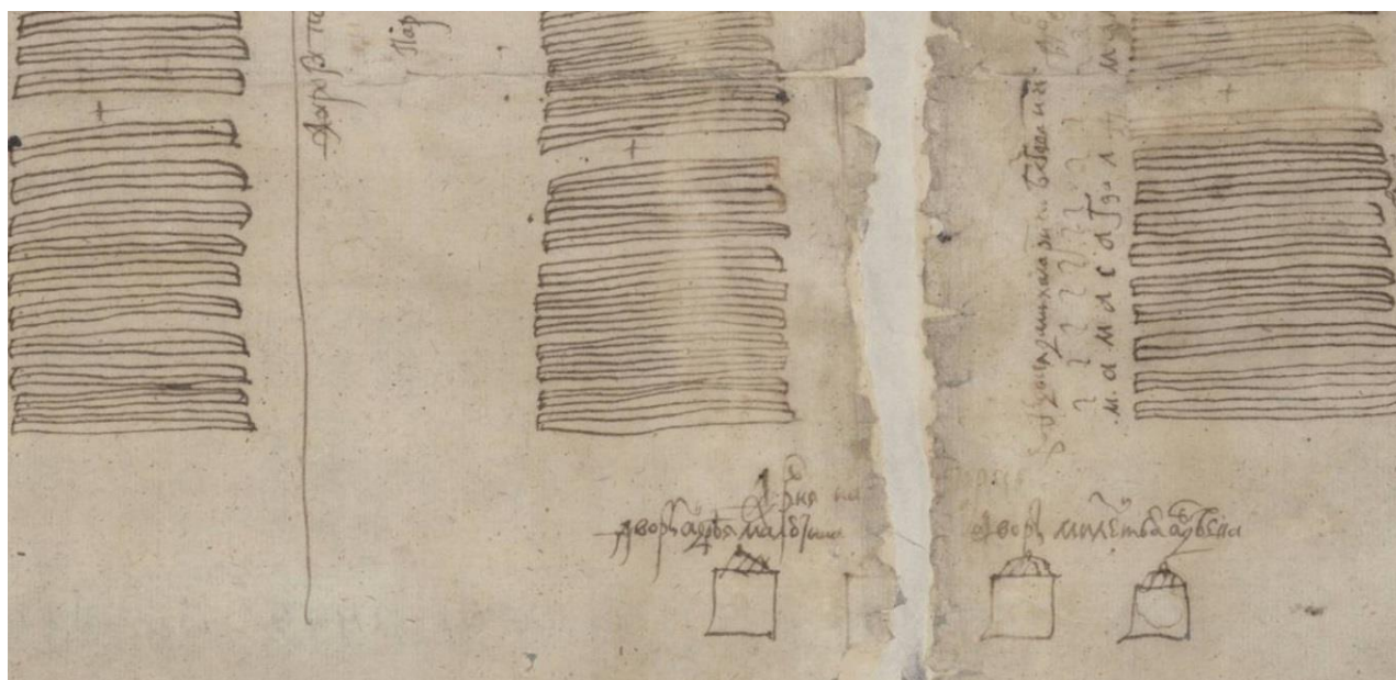
Рис. 3. Изображение крестьянских дворов деревни «на Старых Пересецах»

В легенде карты упоминается «Дмитриевское поместье (...) хина». Это поместье граничит с уже упоминавшимся Андреевским поместьем, границы которого были довольно четко описаны и локализованы на основании документов XVII века. Учитывая предыдущие наработки можно определить местоположение и границы Дмитриевского поместья. Его восточная граница проходила правым берегом речки Горн и озера Молче и оно граничило с Андреевским поместьем. Южная граница находилась в месте, где сейчас расположено село Чаплища. Тут сходи-