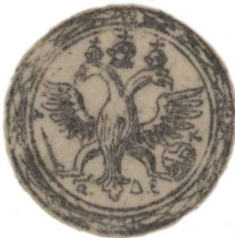
Рис. 4. Гербовый знак – «печать в половину золотого»

Владелец поместья был указан в легенде чертежа, но из-за повреждения бумаги от сохранилось только окончание «...хина». Такое окончание довольно редко встречается среди фамилий помещиков и посадских людей в документах XVI – XVII веков. Наиболее информативными источниками в поиске подходящей фамилии оказались два документа «Отдельная книга» города Путивль 1594 года и «Путивльская писцовая книга 1628 – 1629 гг.». В документе конца XVI века есть упоминание о наделении землёй детей боярских под Путивлем в урочище Крутой лог, которая принадлежала путивльским посадским людям в том числе