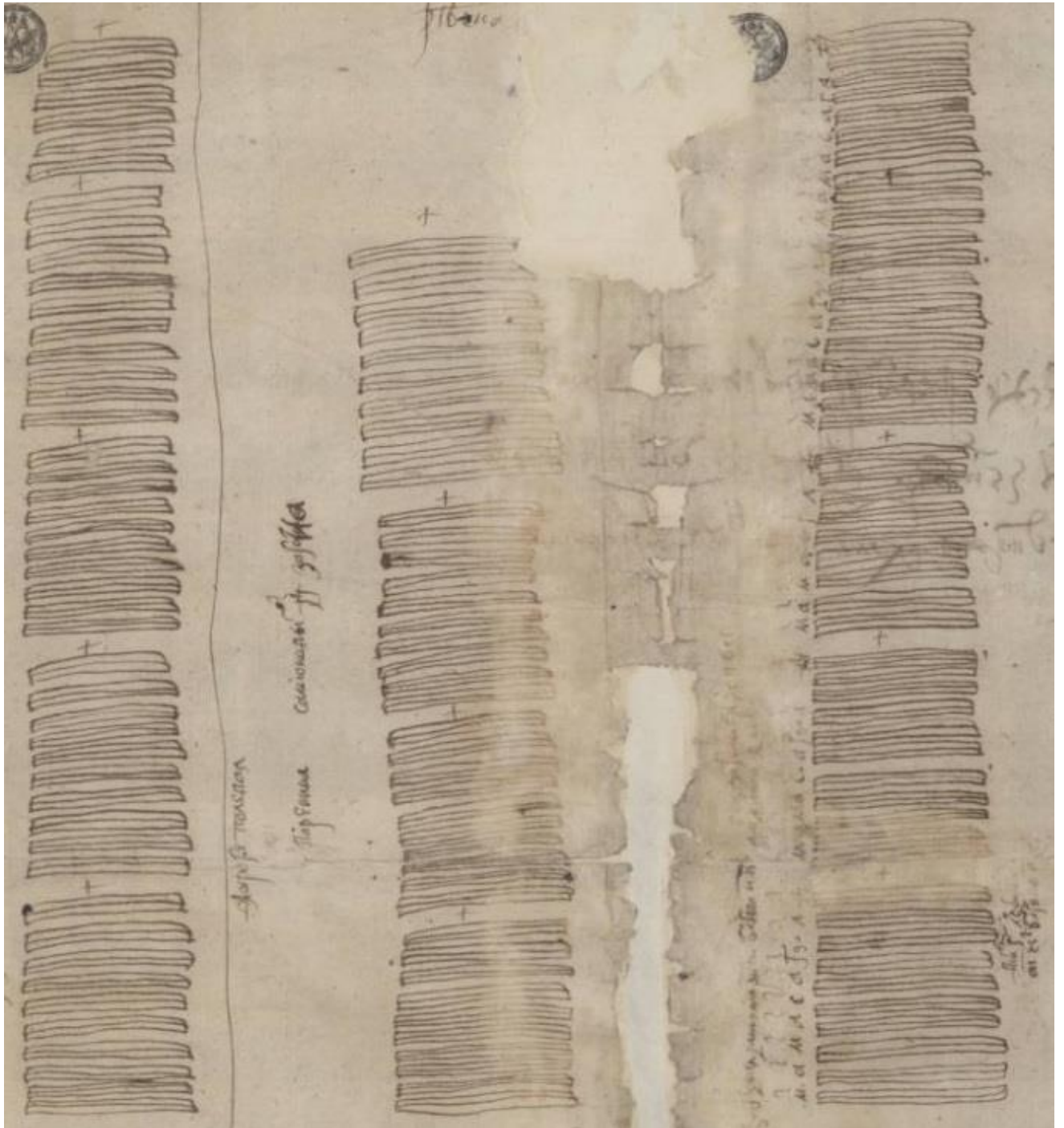
Рис. 2. План земельных наделов с геодезическими пометками

Одной из особенностей чертежа являются изображения крестов, которые разбивают чертёж на 12 относительно равных квадратов. Они расположены между полями и, на первый взгляд, являются знаками,