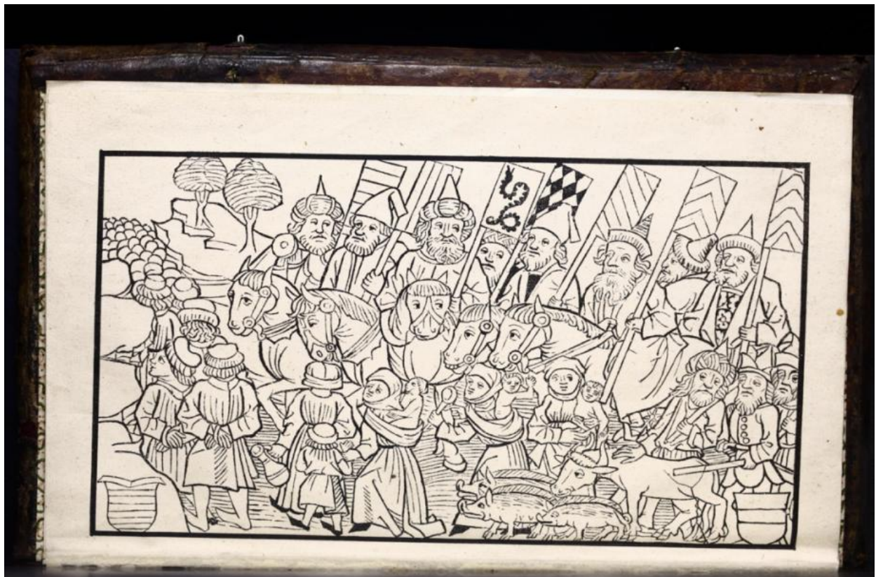
Рис.6. Приход татар в Венгрию во времена короля Бельи IV. Johannes de Thurocz: Chronica Hungarorum. Brno, 1488. Fol .8