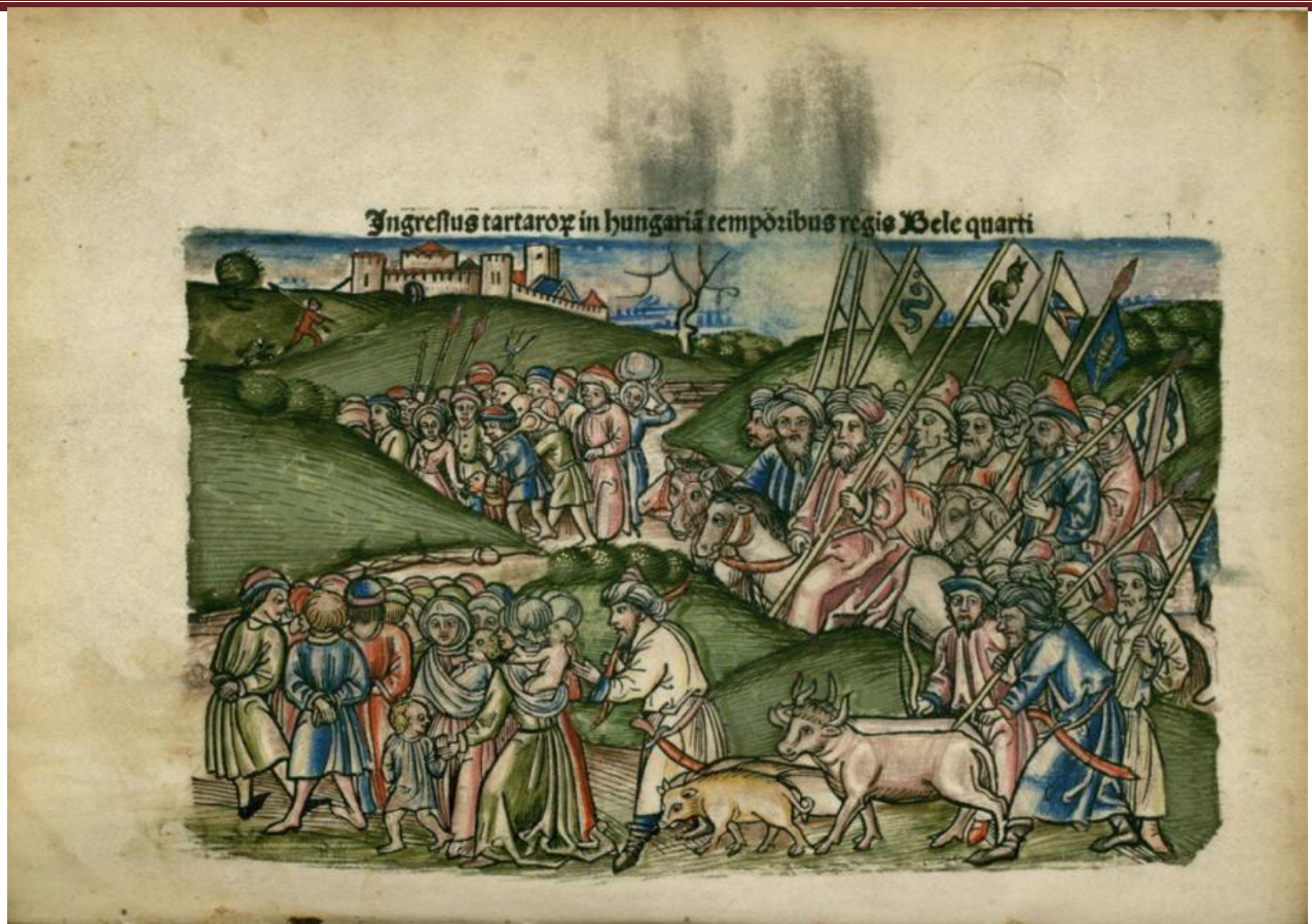
Рис.5. Приход татар в Венгрию во времена короля Бельи IV. Johannes Thuróczy: Chronica Hungarorum. Augusburg 1488 Inc. 1143. x01v.