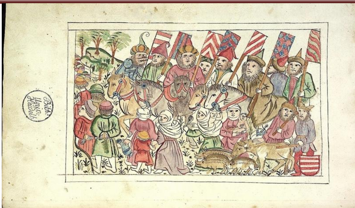
Рис.3. Приход татар в Венгрию во времена короля Белы IV. Johannes de Thurocz Chronica Hungarorum.