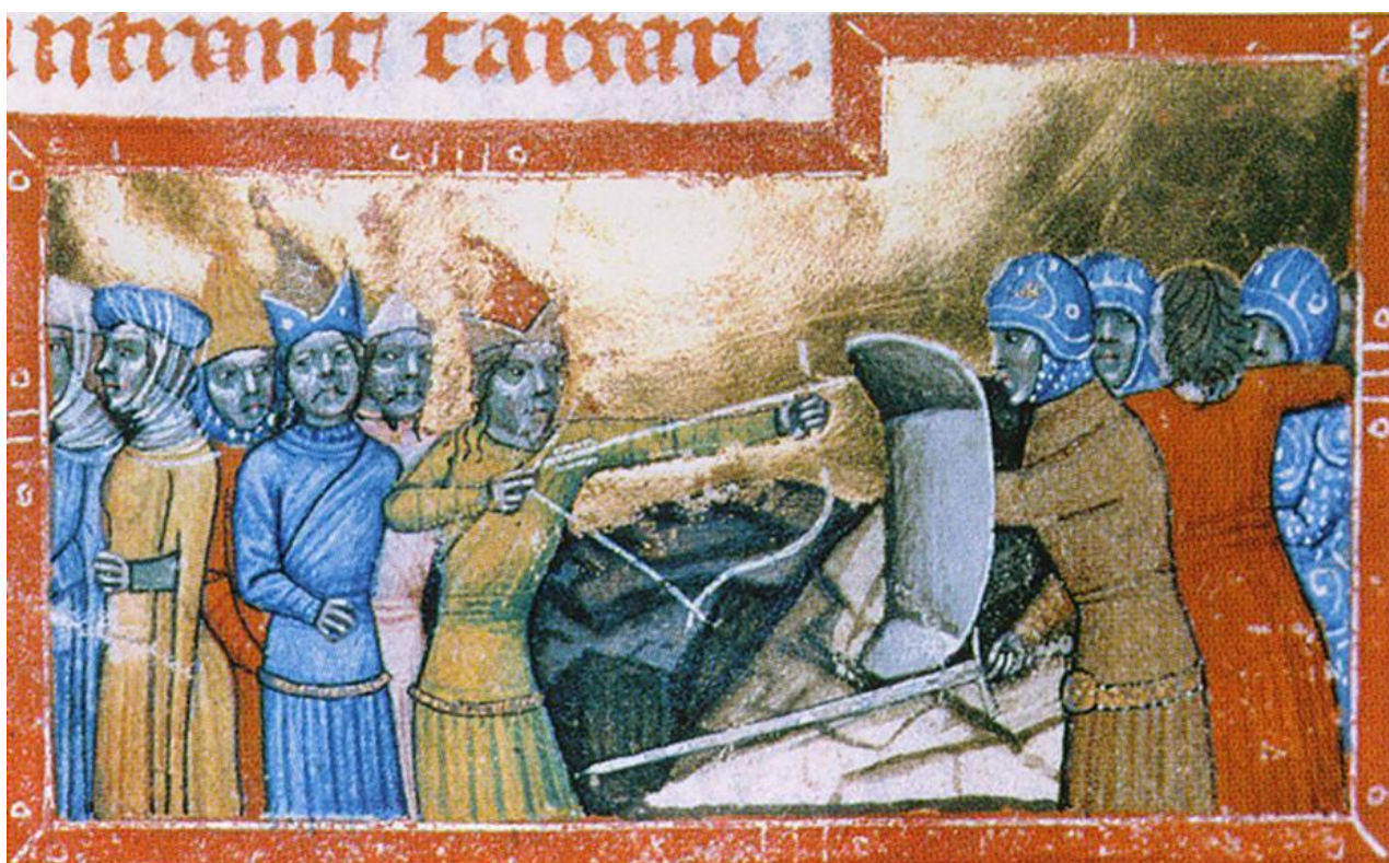
Рис.2. Миниатюра «Монгольское вторжение в Венгрию 1285 г». Венгерская иллюстрированная хроника (Chronicon Pictum). Около 1358 г. Национальная библиотека имени Сеченьи.

падноевропейских миниатюр свидетельствует, что изображение сабли могло играть как социальную роль, так и этническую [30]. С одной стороны, наряду с мечом она могла указывать на социальную стратификацию. Монгольский воин вооруженный саблей или секирой был ниже по статусу, в отличие от тех, в руках которых был меч или трость. С другой стороны, изображая с такими типами боевого вооружения, миниатюристы подчеркивали восточное происхождение и принадлежность к восточной культуре.