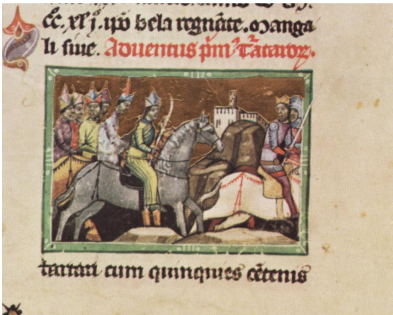
Рис.1 Миниатюра «Побег венгерского короля Белы IV от монгольского войска». Венгерская иллюстрированная хроника (Chronicon Pictum). Около 1358 г. Национальная библиотека имени Сеченьи

(Chronicon Pictum)» запечатлён побег венгерского короля Белы IV от монгольского войска (См. Рис.1) [34, fol. 125]. Справа изображен венгерский правитель, носящий корону – символ власти, а слева – монгольские воины, с азиатскими чертами лица, характерными восточным народам головными уборами и типичными монгольскими длиннополыми халатами.