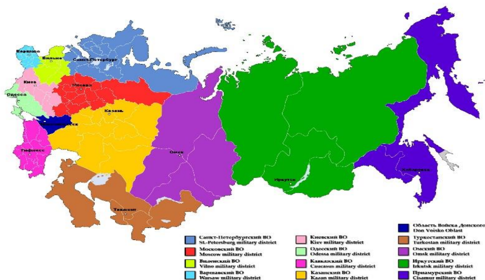
Рис. 1. Военные округа РИ на 1913 г. [3-4]

КВО – это оперативно - стратегическое территориальное объединение вооружённых сил, существовавшее в РИ. Он образован указом от 6.08 1864 г. в ходе реформ военного министра Д. А. Милютина, разделившего всю территорию РИ на военные округа (табл.1).