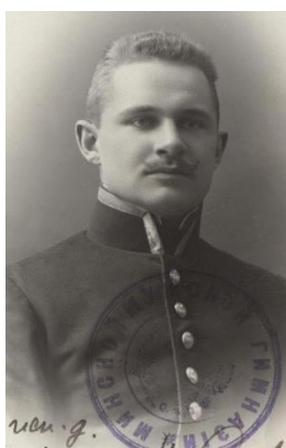
А) 1911 [7]

жить. По состоянию на 08.07.1911 г. проживал по адресу: г. Борисов, Минской губернии, Михайлова улица, д. Павл...[неразборчиво] [7].