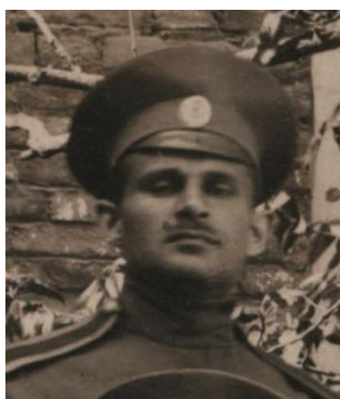
Б) 1916 [1]