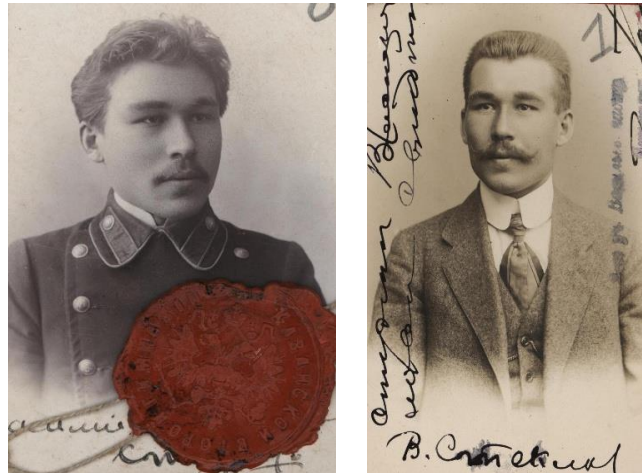
а) 1908 г.