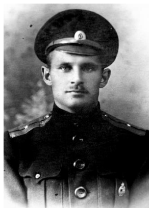
В) 1916 [8]