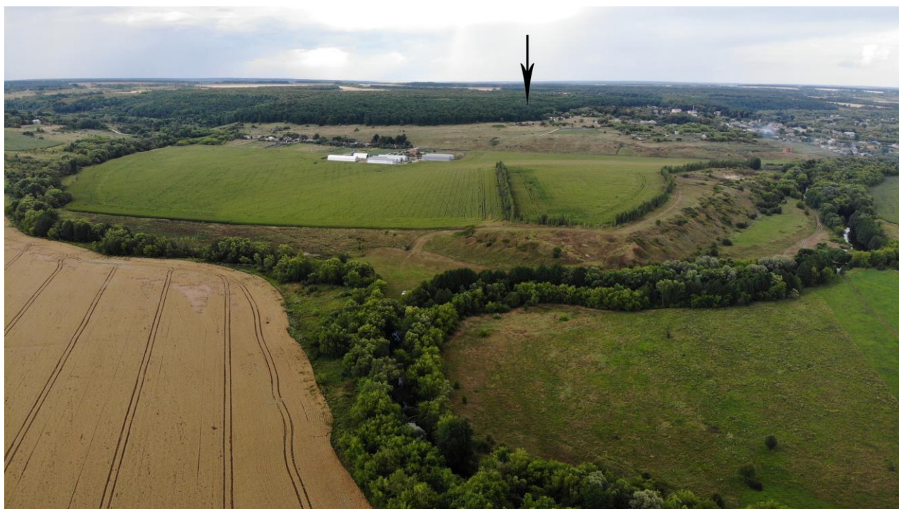
Рис. 1. Вид на расположение курганного могильника "Рублевка, курганная группа-1".

насыпей (обваловка "ритуальных площадок" (?). Тогда же ОАН был поставлен на государственный учет как вновь выявленный памятник археологии. В ходе разведки в 0,46 км к ССЗ от курганной группы-1, в том же лесном массиве, была выявлена еще одна компактная курганная группа "Рублевка, курганная группа-2", состоящая из 9 курганных насыпей (рис.1). Отметим, что ранее этой же экспедицией обследовался приток р. Снова – р. Кобылья Снова [2].