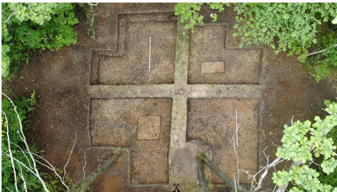
Рис.4. Курган в процессе раскопок. Вид сверху.

Раскопки кургана 1 носили спасательный характер. Он расположен в центральной части курганной группы, на ее восточном краю. Его насыпь имела неправильно округлую, полусферическую форму, диаметром 13-14 м, Высота насыпи до 0,6-0,7 м. Курган раскапывался полностью, с частичным захватом прилегающего к нему пространства. Общая площадь раскопа составила 160 кв. м, из которых 30-31 кв. м приходится на непосредственно прилегающее к насыпи пространство (рис.2,4).