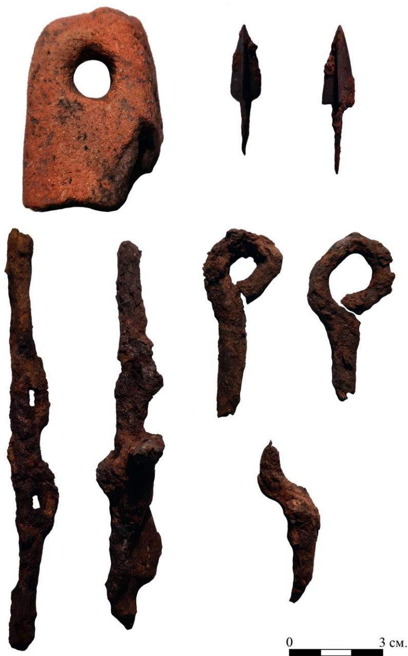
Рис. 5. Находки из кургана 1.

Яма оказалась грабленой, по-видимому, еще в древности. Каких-либо антропологических находок в ней не выявлено, что объясняется, вероятно, почвенными условиями. На частично сохранившемся перекрытии могильной ямы лежали детали железной конской упряжи со стержневыми псалями раннего железного века (рис.5).