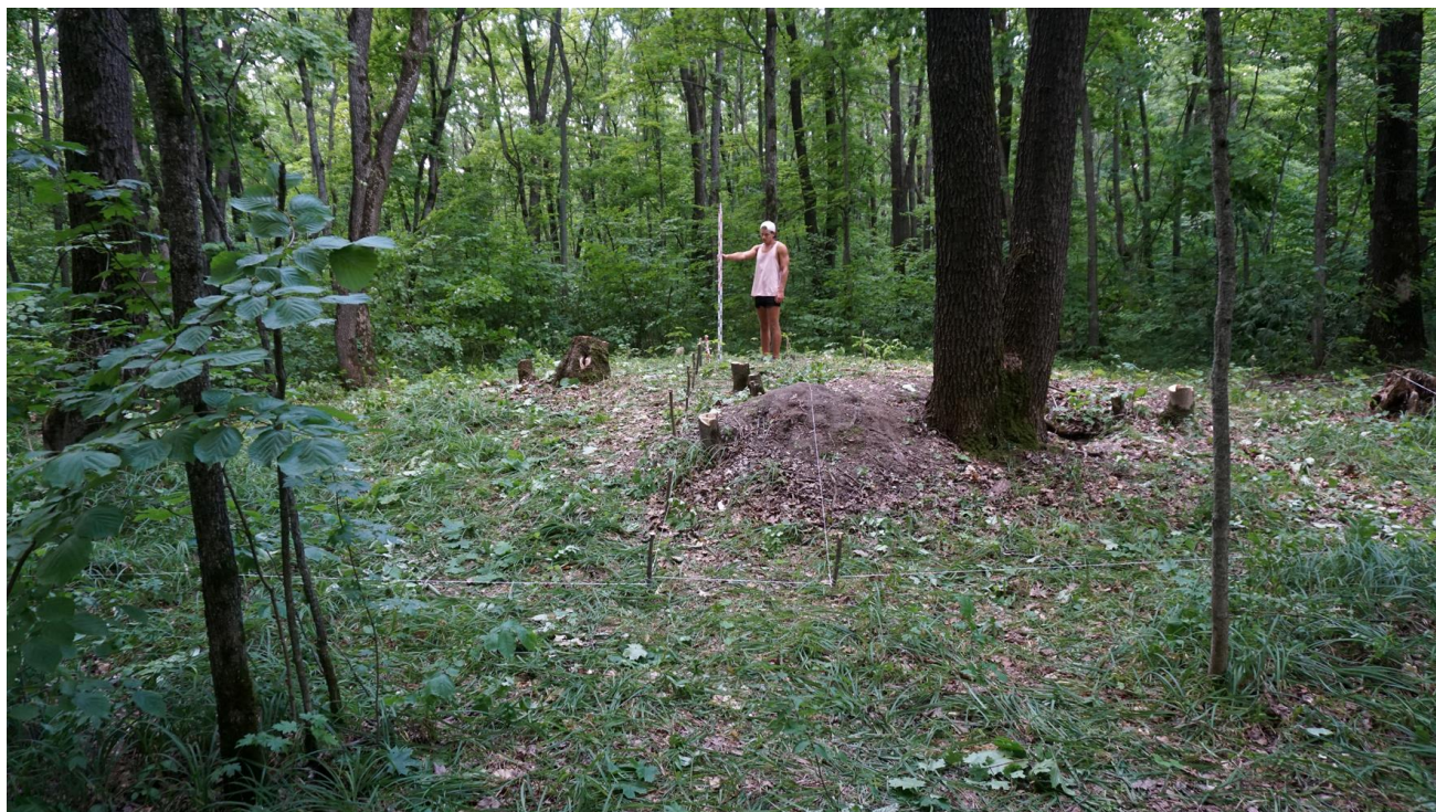
Рис. 2. Вид на курган 1 до раскопок.

Кольцевые насыпи валообразной формы, формирующие округлые площадки, имели значительные размеры от 23х26 м (№ 10) до 39х40 м (№ 100), являясь самыми крупными по площади, выявленными в могильнике, структурами. Сами валы широкие, низкие, уплощенные и расплывшиеся.