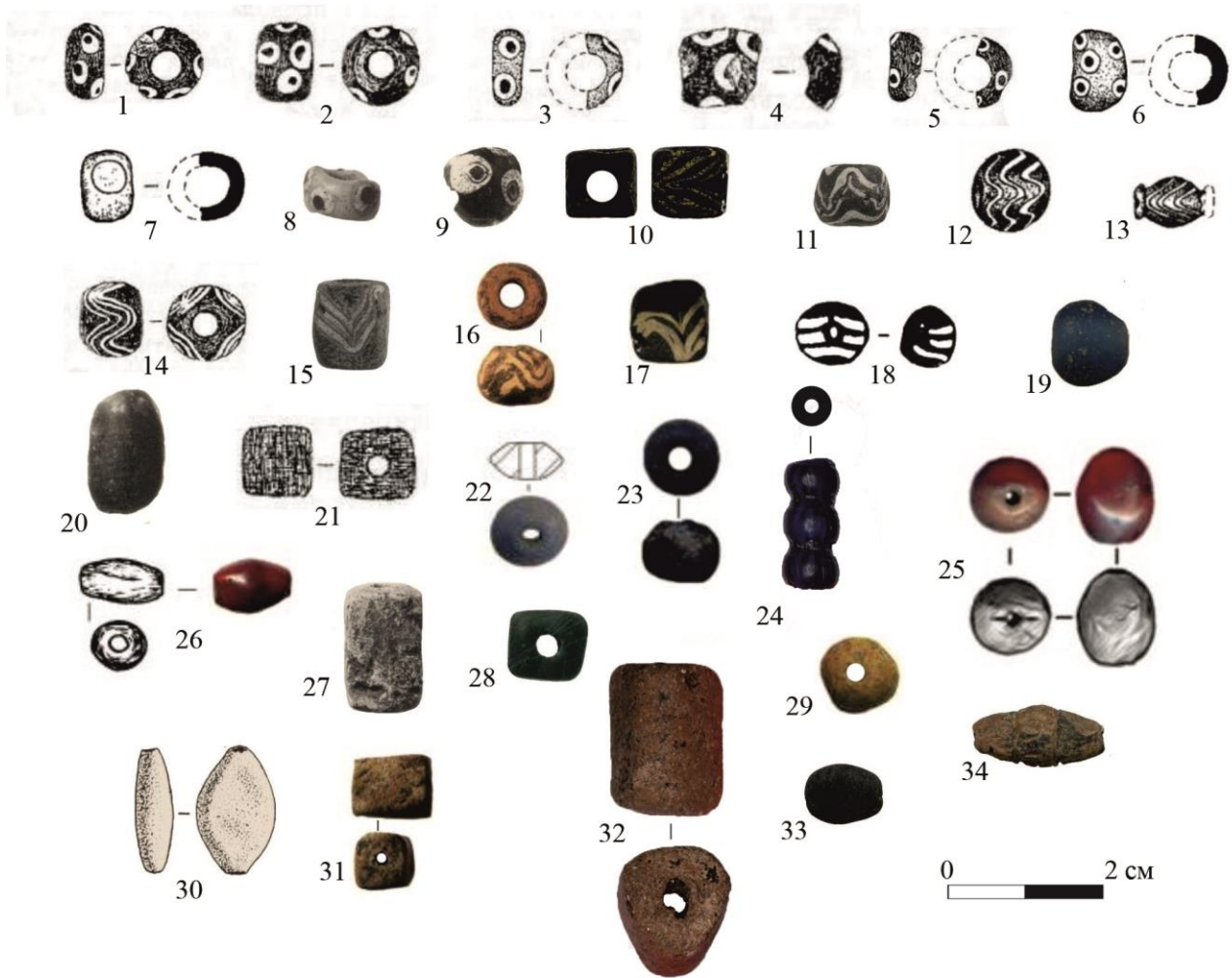
Рис. 2. Основные типы бус скифского времени

с поселенческих памятников лесостепного Подонья