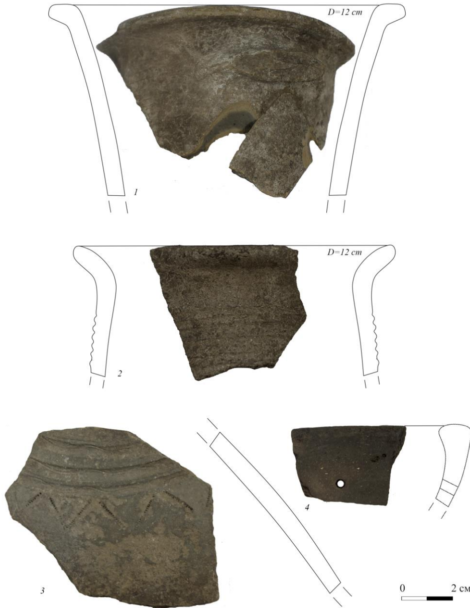
Рис. 2. Гончарная керамика сарматского времени

2), стенка одного из них украшена комбинацией радиальных линий и зигзагов. Следует отметить, что развалы нескольких гончарных кувшинов были обнаружены в юртообразной столбовой постройке. Аналогии сероглиняной и чернолощеной керамики легко найти на меотских городищах Кубани и Нижнего Дона [1, с. 91; 15, с. 42-43].