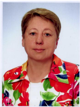
Рад Н. С.