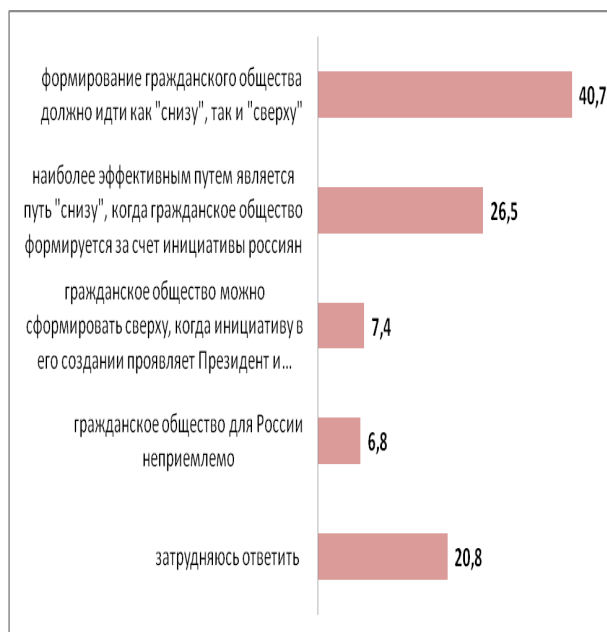
Рис. 3. Наиболее эффективные пути формирования гражданского общества в России, в оценках ивановцев, в % (n=510)

Аналогичные корреляции раскрывают ответы на вопросы о путях формирования ГО. Лишь 6,8% выразили мнение о его неприемлемости для России, в то время, как 40,7% поддержали мнение о его возможности его создания совместными усилиями общества («снизу») и государства («сверху»). 26,3% отдали приоритет пути «снизу», когда ГО формируется за счет инициативы россиян.