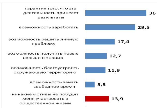
Рис.2. Мотивы участия населения в общественной жизни региона, в % (n=510)

Мнения о степени развития ГО в стране (в условиях выбора одного из предложенных вариантов ответа) оказались противоречивыми. На фоне 10% опрошенных, выразивших мнение о наличии в России гражданского общества, представительные группы респондентов отметили, что его формирование идет, но еще далеко от завершения (24%); что в ближайшее время оно вряд ли будет сформировано (22%); и что оно формировалось, но в последнее время целенаправленно уничтожается (21%). Последняя цифра коррелирует с долей тех, кто считают, что привлечь внимание властей можно лишь посредством акций протеста (28,9%) и процентом выражающих мнение, что граждане вообще не в состоянии влиять на органы власти (26,7%). Для 17,1% такая позиция является препятствием для личного участия в институтах ГО и их деятельности.