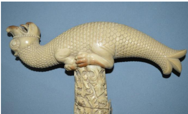
Рукоять трости из слоновой кости. 19 век. Из собрания музея Д.Г. Бурьлина

В эпоху Возрождения, трость превратилась в стильный аксессуар. В дальнейшем она стала обязательным элементом придворного этикета и наряда английских и французских дворов XVII-XVIII веков. Отделка трости говорила о вкусе и финансовом положении своего владельца. Часто после краснодеревщика она отправлялась к ювелиру.