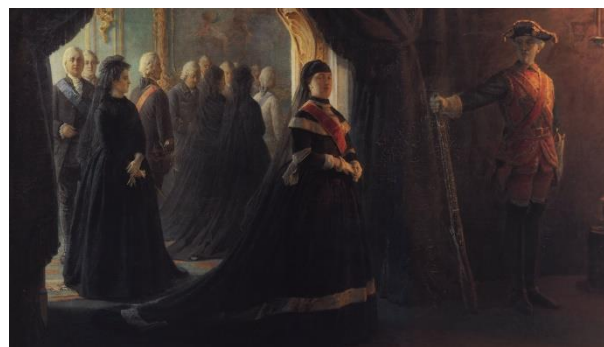
Ге. Екатерина II у гроба Елизаветы Петровны

В дальнейшем, в XVIII веке, когда прическа воспринималась как головной убор, чепцы были украшением сложных причесок, либо защитой замысловатых сооружений от повреждений во время путешествий или сна. Из наиболее известных чепцов XVIII века были фасоны: «Мария Стюарт» – с мыском, спускающимся на лоб, как в средневековых головных уборах (в траурном чепце такого покроя изображена Екатерина II у гроба императрицы Елизаветы Петровны на картине Н.Н. Ге, 1874). Дормез, открывающий волосы надо лбом, но закрывающий уши.