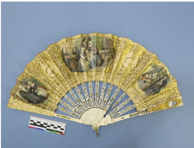
Веер. 19 век. Из коллекции музея Д.Г. Бурлыгина

шительны» - веер держится стрелой; «Ты мой кумир» - полностью раскрыт» [3, с. 70]. Цвет веера подбирался не только к туалету, но и мог содержать информацию о настроении владелицы: «черный – печаль, красный – радость, лиловый – смирение, голубой – постоянство, верность, желтый – отказ, коричневый – недолговременное счастье, черный с белым – разрушенный мир, розовый с голубым – любовь и верность, убранный блестками – твердость и доверие» [4, с. 110]. Чтобы выразить согласие - следует приложить веер левой рукой к правой щеке. Нет – приложить открытый веер правой рукой к левой щеке. Будьте осторожны, за нами следят – открытым веером дотронуться до левого уха. Не приходите поздно – правую сторону открытого веера держать перед тем с кем ведется разговор, а потом быстро закрыть его. Не приходи сегодня – провести закрытым веером по наружной стороне руки» [4, с. 110].