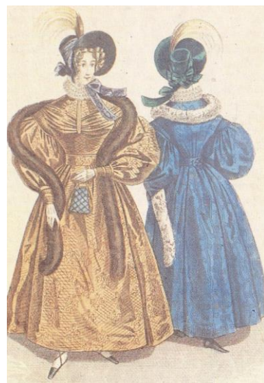
Ридикюль. Рисунок в журнале Московский телеграф за 1832 г.

В России муфта получила распространение в XVIII веке как деталь мужского и женского туалета. Во второй половине XVIII в. редкий модник обходился без муфты. «В руках щеголя непременно должна была быть соболья или сделанная из длинной шерсти украинских овец белая муфта, называемая «манька». Они были необходимы во время пеших прогулок» [9, с. 452]. Муфты носили на шнурах и цепочках. Их форма подчинялась моде – они были то в виде огромных квадратов, то в виде крохотных цилиндров, в которые едва можно было втиснуть руки. Муфты могли быть не только меховыми, но и из ткани на теплой подкладке, отделанные шнурами и вышивкой. Обычно муфта в женском костюме составляла ансамбль с меховой шапкой и воротником. С внутренней стороны муфты имели карманчик для ношения мелких предметов. Долгое время она служила особым социальным признаком, так как в народном представлении это – принадлежность знати, изнеженного щеголя или щеголихи, берегущих руки от холода. В России муфта как распространенный предмет женского гардероба сохранилась надолго.