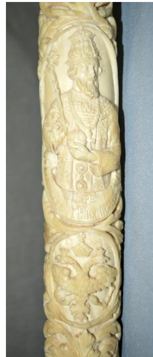
Трость из слоновой кости. 19 век. Из собрания музея Д.Г. Бурulina

немыслимы без карманов – пиджаки, брюки и пальто. Пальто и пиджаки имели также множество внутренних потайных карманов. Наружные карманы, по-прежнему, сохраняли декоративное значение, в них редко что-либо носили, чтобы не утратилась форма, во многом определявшая облик одежды, которая должна была создавать впечатление безупречной опрятности. В XVIII веке в женской одежде появились потайные карманы, вшитые в боковые швы юбок, но их не так просто было заметить. В 1810-1820-е годы женские платья стали небольшого объема – «пребезобразные; узкие как дудки» [10, с. 288]. Но в начале 1830-х годов в журналах сообщалось: «Карманы опять начали употреблять. Сперва, означали на платьях только место кармана оборочкой или шитьем; потом к некоторым платьям для украшения пришили карманы, а теперь находят в них пользу. Ныне большую часть платьев делают с маленькими карманами по бокам» [15, с. 469].