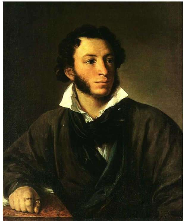
В.А. Тропинин Портрет А.С. Пушкина

тельным упрощением мужского костюма, связанным с активизацией образа жизни, для которого старая конструкция галстука оказалась мало пригодной. Мужчинам в 1820 годы давали следующие рекомендации по завязыванию галстука: «Завязав бант галстука, прикрепите тесемочку; пропустив под мышком, переложите крест на крест на спине, обведите кругом и, соединяя вместе на грудях, пришилите розеткою. С помощью такой бант не будет ни подниматься, ни опускаться. Правый конец сверху вниз. При соблюдении этого условия сзади не образуется выпуклость, которая происходит обыкновенно позади шеи от встречи двух концов» [5, с. 30,32].