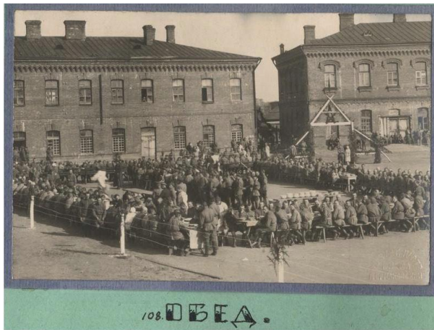
Праздничный обед артиллерийского полка 1 мая [1925 г.]. Госкаталог. № 5193778