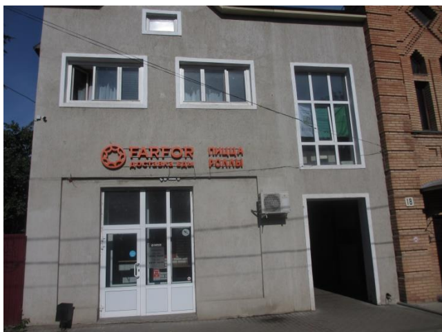
Современный вид здания фотографии Пролет-культы. 2022 г.