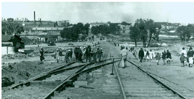
Прокладка трамвайных путей. Площадь Пушкина от Туляковского моста. Иваново, 1934 г.

вич Хохлов; фотограф Архитектурно-планировочного управления Горкомхоза Николай Николаевич Киселёв, ретушёр фотографии Пролеткульта Юлия Тимофеевна Бабинова, а также клиент фотоателье Вермаховского бухгалтер Горкомхоза Николай Андреевич Киселёв.