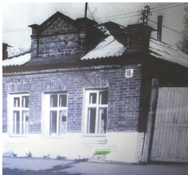
Здание бывшей фотографии Пролеткульта (улица Московская, дом № 18а). 1970 г.

Фотографии, выполненные Н.Н. Киселёвым, сохранились, в частности в ивановском Музее промышленности и искусства. Они используются на выставках, например, на выставке-экспозиции «Иваново-Вознесенск. На стыке времён». В рассказе о представленных на ней изображениях города говорится: «Искусство фотографии как нельзя лучше отражает образы города советской эпохи. Большинство снимков были сделаны в 20–30-е годы XX века фотографом Н.Н. Киселёвым.