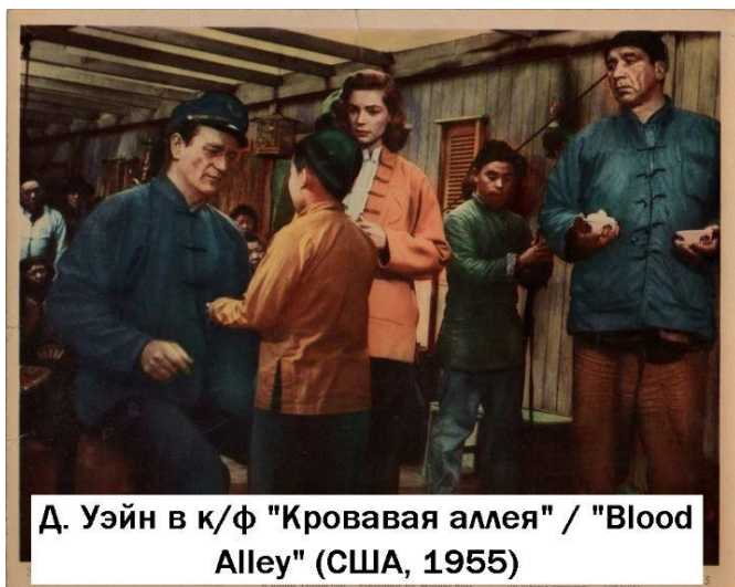
Д. Уэйн в к/ф "Кровавая аллея" / "Blood Alley" (США, 1955)

Наконец, третий аспект, связан с объективной историографической и имагологической репрезентацией, источниковедческой и эпистемологической комплементарностью. Также, как в российской историографии период маккартизма в США конца 1940 – середины 1950-х гг. рассматривается как феномен, оказавший травматическое и требующее преодоления воздействие на американское общество, в равной степени оценки, даже созданные в документах «холодной» эпохи и обладавшие имманентной идеологической пристрастностью, на современном интеллектуальном пространстве могут и должны быть конвертированы для создания позитивного, положительного ресурса, направленного на создание конструктивного интеллектуального диалога и подлинной интеллигенции [40; 41], недопущение деструктивной индоктринации, вызвавшей к жизни репрессивные практики сталинизма.