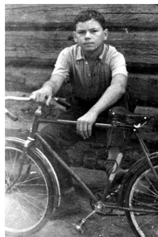
На каникулах в г. Витебске, 1959 г.

С некоторыми из одноклассников мы поддерживали связи до 2000 года. А потом телефоны перестали отвечать... С однокурсниками из техникума продолжаем общаться до сих пор. Наш выпуск был в 1965 году, поэтому не все живы. Но с некоторыми и лично встречаемся до сих пор. Встречаюсь с бывшими однополчанами по спецназу, с однокашниками по вузу. К сожалению, многие уже ушли из жизни.