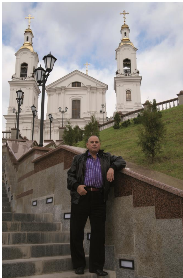
В Витебске спустя годы после учебы в техникуме