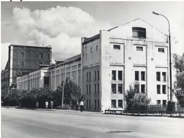
Здание Ивановского нардома

37], и в новой статье проследим, как она развернулась дальше.