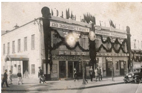
Здание театра ОСПС, позднее театра музыкальной комедии

Осенью 1933 г. в городе Иванове, центре огромной Ивановской промышленной области (ИПО), впервые в истории сезон открыли поочередно два драматических театра. Еще недавно, до февраля данного года, список профессиональных театральных коллективов, работавших в городе, был другим: один драматический и один оперный. Но с 1933 г. история театральной жизни города пошла по новой стезе.