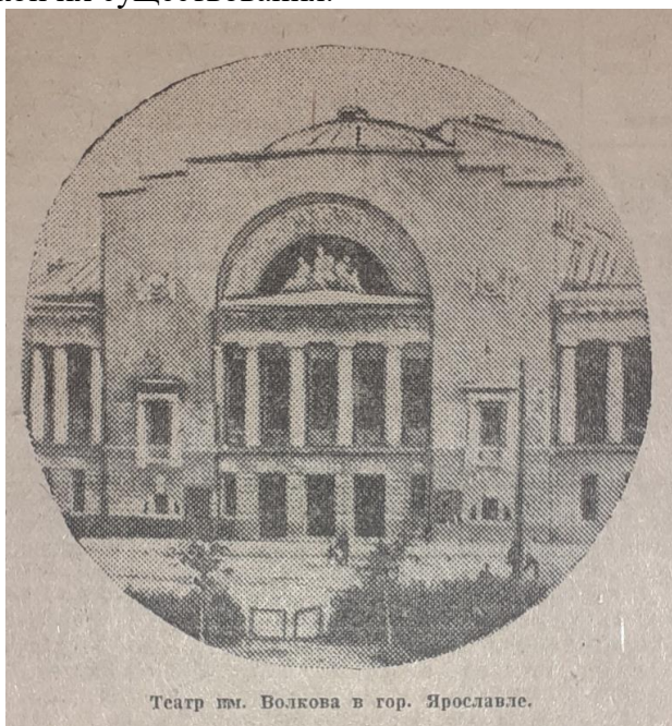
Театр им. Волкова в гор. Ярославле.