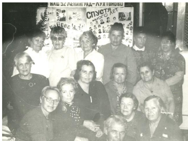
Встреча выпускников детского дома. Санкт-Петербург

вспоминает приемных родителей и благодарит их за то, что дали образование и окружили любовью и заботой [17, С. 130-132].