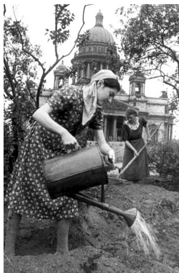
В ожидании урожая

Власти массово издавали брошюры, в которых рассказывали, как обрабатывать землю, какие травы подходили для употребления в пищу. Люди стали выращивать овощи в парках и скверах и делали заготовки на зиму. Так, например, в сквере рядом с Исаакиевским собором собрали большой урожай капусты.