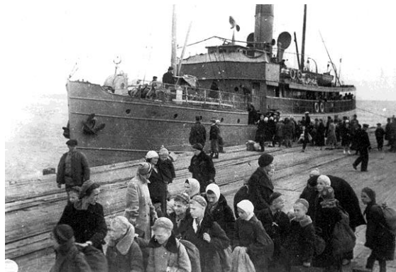
Эвакуация по воде

В Ивановскую область в 1942 году было эвакуировано 52 детских дома с общим количеством воспитанников 6072 человека. Дети были размещены в домах отдыха, школах и других помещениях. Жители Ивановской области жили скученно, голодно, бедно, но к приему ленинградцев все готовились с особым воодушевлением. Ремонтировали бани, общежития, изготавливали топчаны, раскладные кровати. Детским домам передавали вещи и предметы оборудования. Колхозы области выделяли продукты питания: яйца, молоко, сливочное масло, картофель, муку, крупы, а так же денежные средства [10, л. 143].