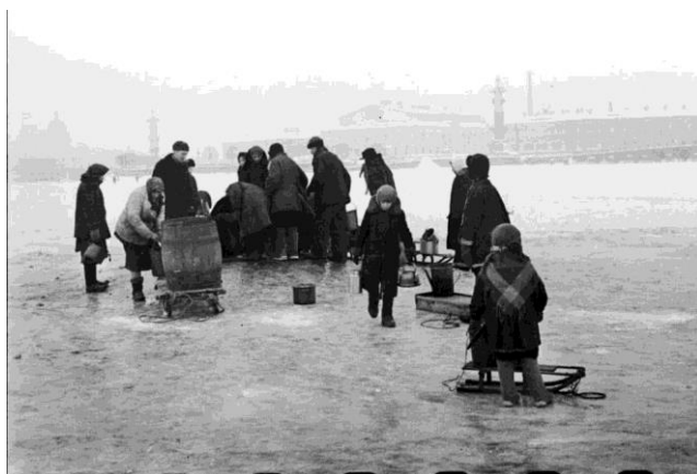
За водой. 1942 г.

Огромное значение для блокадников имела Дорога жизни - ледовый путь через Ладожское озеро, который функционировал с 22 ноября 1941 года по 23 апреля 1942-го года. Именно эта связь с Большой землей позволила к весне 1942 года создать в городе продовольственный запас на 2 месяца, в результате которого, была увеличена норма выдачи хлеба.