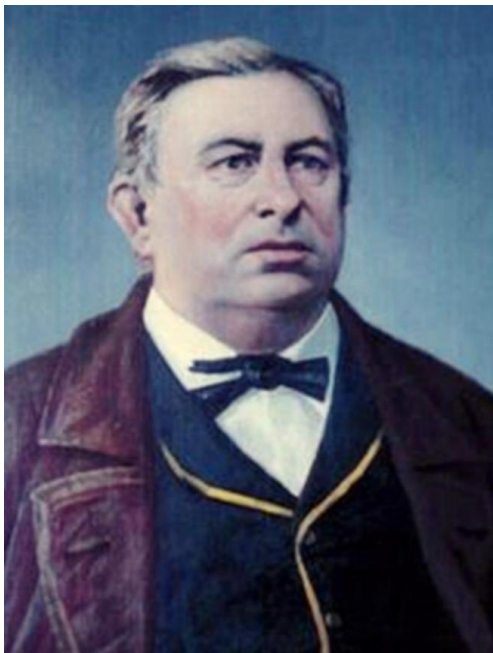
Я. П. Гарелин

четный гражданин города Иваново», В честь него названа улица в областном центре, а 30 мая 2011 года ему открыт памятник.