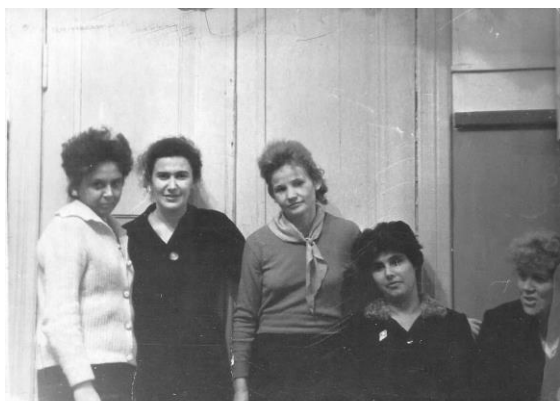
Педагогический коллектив школы № 102, 1960-е гг.

всех: в простую кофточку и темную юбку; слегка наклонив голову, она с полуулыбкой смотрит на зрителей.