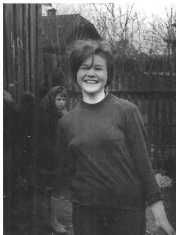
На субботнике

Ежегодно весной, как правило, незадолго до дня рождения В.И. Ленина (22 апреля) в школах проводили субботники по уборке территории. Ученики рассматривали это и как возможность подышать свежим воздухом, и как доказательство лучшей работы своего класса. Поэтому на двух фотографиях они радостно смеются и улыбаются.