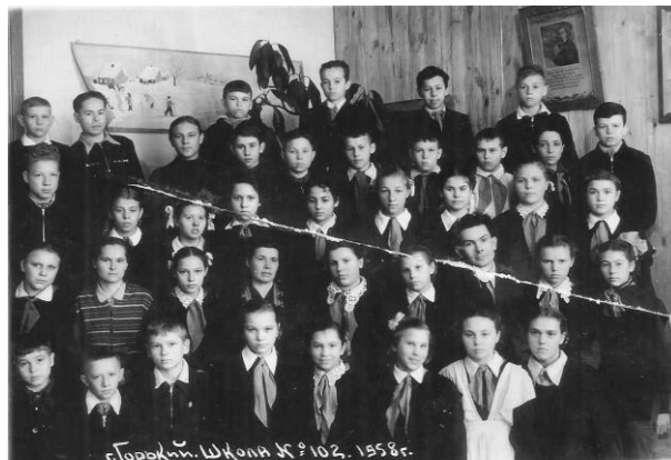
г. Горький. Школа № 102. 1958 г.