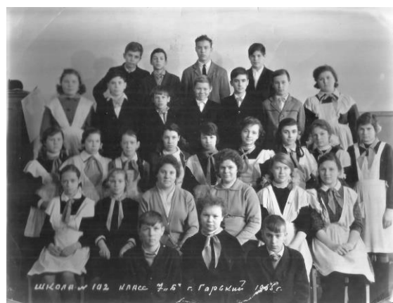
Школа № 102. Класс 7 "Б" г. Горький. 1965 г.