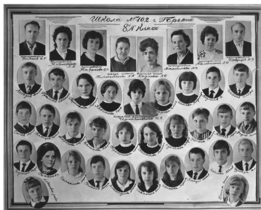
Школа № 102. 8 "А" класс

Две выпускные фотографии 8 «А» и 8 «Б» классов сделаны гораздо позднее, однако годы неизвестны. Они сделаны по другому образцу: погрудные фотографии каждого ученика помещены в овальные рамочки, все они подписаны. Над ними в квадратных рамочках так же подписаны фотографии учителей.