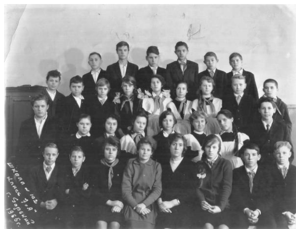
Школа № 102. Класс 7 "А" г. Горький. 1965 г.