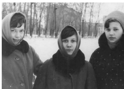
Зимой перед школой

Хороша неподписанная фотография трех школьниц зимой: одетые в скромные зимние пальто, теплые платки и шапочку, они внимательно смотрят и застенчиво улыбаются фотографу.