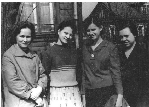
Весной на уборке школьной территории