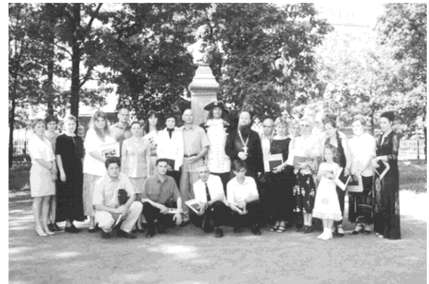
Выпуск в Санкт-Петербургском филиале Института управления, 2002 г.

Сохранились после только головной институт и филиал в г. Иваново. Мы были вынуждены снижать заработную плату. На это пошел только Ивановский филиал, поскольку его руководство могло мыслить стратегически, а не одним днем. Остальные филиалы отказались пойти на такое сокращение расходов, в силу чего сразу стали убыточными. Институт их финансировать не мог, потому что и сам испытывал те же