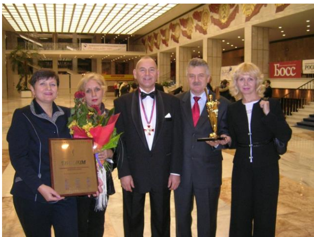
Вручение Международному институту управления премии «Российский Национальный Олимп». Москва, Кремлевский Дворец, ноябрь 2005 г.

Прославление спортивных достижений России было реализовано нашими силами, без государственной поддержки.