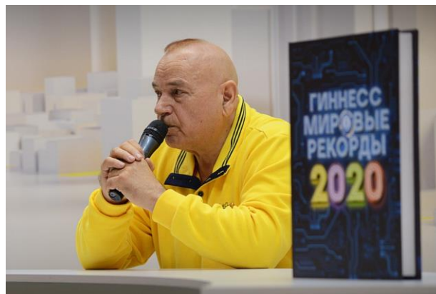
На Московской международной книжной выставке-ярмарке, сентябрь 2019 г.

На мой взгляд, все сферы человеческой деятельности могут быть связаны с философскими размышлениями, которые помогают по-другому взглянуть на проблему, найти не трафаретные пути ее решения. А литературная деятельность способствует улучшению философского мышления. Она дает в том числе возможность рассказать о каких-то научных интуициях, о которых еще не время говорить в рамках академической науки.