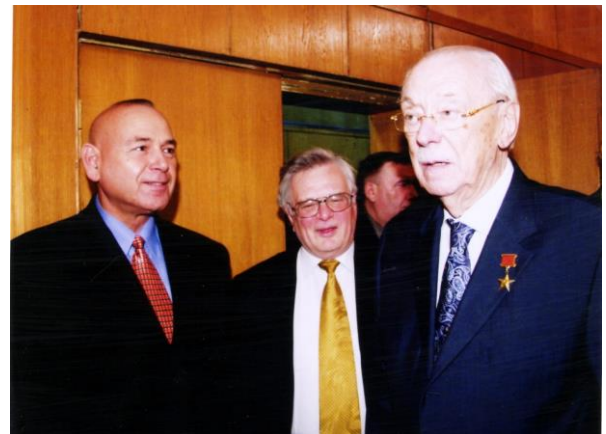
С известным советским и российским писателем, Героем Социалистического Труда С. В. Михалковым

Многие творческие встречи Вы проводите в Центральном доме литераторов в Москве. С кем из московских писателей у Вас сложились наиболее добрые отношения?