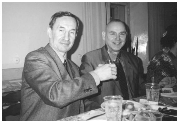
С двукратным Олимпийским чемпионом по хоккею Виктором Кузькиным. Москва, 2003 г.