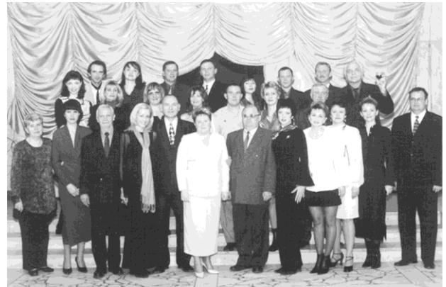
Выпуск в Волгоградском филиале Института управления, 2002 г.

сложности. Поэтому все филиалы, кроме Ивановского, который выдержал эти тяжелые времена, один за другим закрылись.