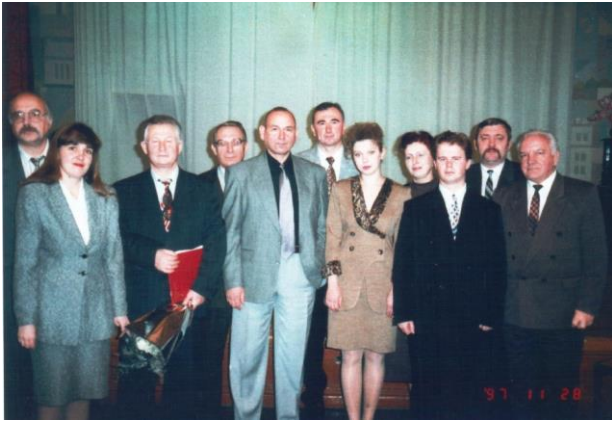
В Ивановском филиале Института управления, 28 ноября 1997 г.

сложной финансовой ситуации, когда хронически не хватало денег.