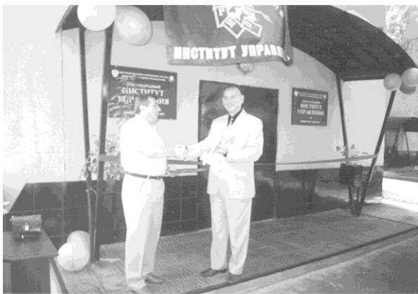
Открытие учебного корпуса Института управления в Ярославле. 2002 г.