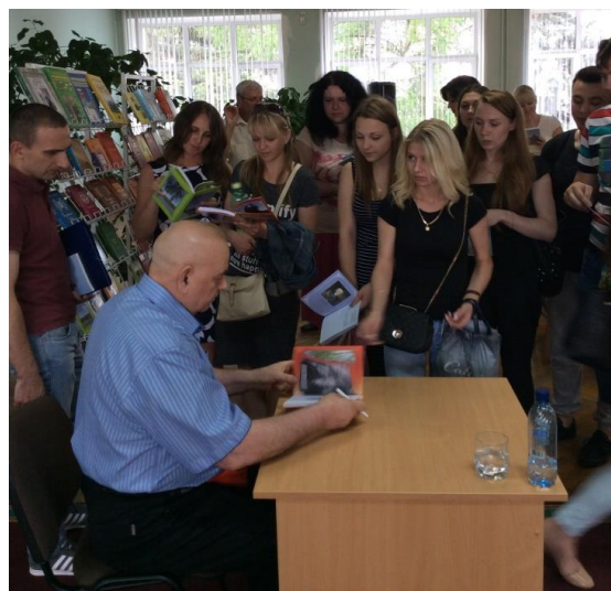
На презентации в Витебске

А это как-то само собой получилось. У меня много товарищей в писательской среде. И многие из них стали говорить, что надо вступить в творческий союз, потому что вышло на тот момент уже около пятидесяти книг. Написали рекомендации. Так я был принят в Союз писателей России.