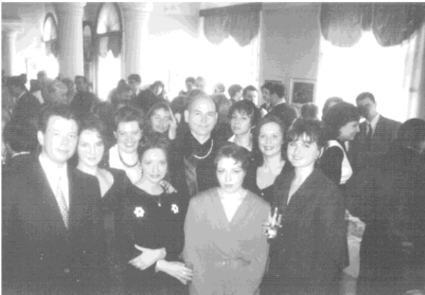
Выпуск в Архангельске, 1999 г.