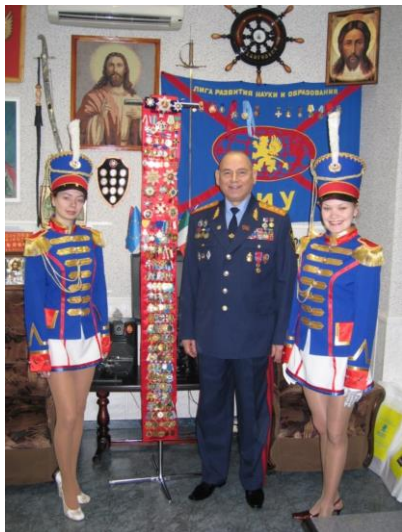
На собственном юбилее в Международном институте управления. г. Архангельск, 2006 г.

не достигнут больше ни одним вузом в мире, так как нет второго вуза, который получил бы свыше 500 сертификатов Гиннеса в силовых видах спорта. Наш вуз единственный, спортсмены которого установили мировые рекорды на всех континентах, во всех частях света. Считаю, что это выдающийся показатель, достойный включения в Книгу рекордов Гиннеса.