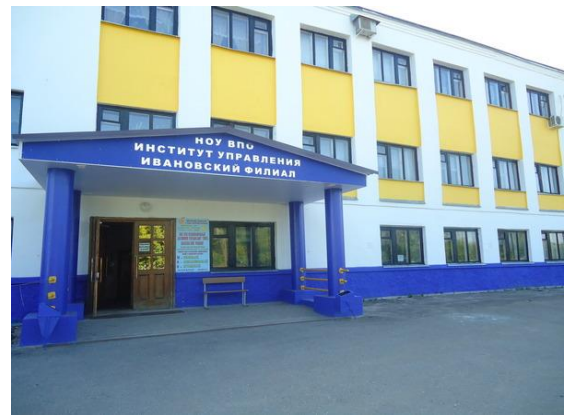
Институт управления. Ивановский филиал

Во-первых, оба города – областные центры. Во-вторых, хотя они и находятся на расстоянии всего ста километров друг от друга, у их жителей совершенно разный менталитет – даже говор разный. Ну, и самое главное: мы использовали все возможности расширения Института управления, чтобы он максимально был представлен в разных субъектах Российской Федерации.