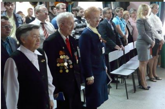
Поздравление ветеранов Великой Отечественной войны, работавших в Институте управления, 8 мая 2009 г.