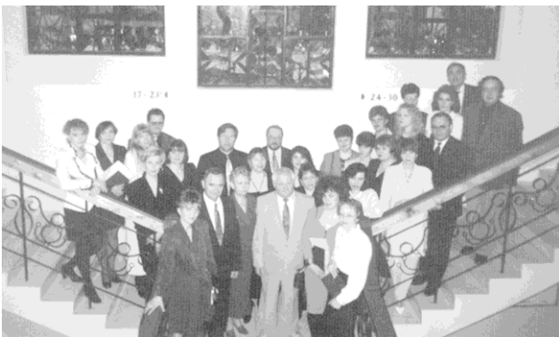
Выпуск в Ханты-Мансийском филиале Института управления. 2001 г.

Сохранились после только головной институт и филиал в г. Иваново. Мы были вынуждены снижать заработную плату. На это пошел только Ивановский филиал, поскольку его руководство могло мыслить стратегически, а не одним днем. Остальные филиалы отказались пойти на такое сокращение расходов, в силу чего сразу стали убыточными. Институт их финансировать не мог, потому что и сам испытывал те же