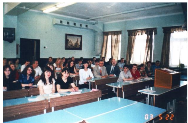
Научно-практическая конференция в Ивановском филиале Института управления, 22 мая 2003 г.

Сейчас развиваем среднее профессиональное образование; при Институте управления в Архангельске и при Ивановском филиале открыты колледжи.