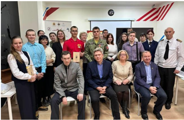
Участники XLIII Архангельских общественно-научных чтений по военно-исторической тематике «Защитники Отечества»

В XVIII веке Архангельск был единственным торговым портом Севера России и приобрёл исключительное для государства значение. Пётр I понимал, что шведы не оставят Север в покое, особенно после превращения Архангельска в центр судостроения и внешней торговли.