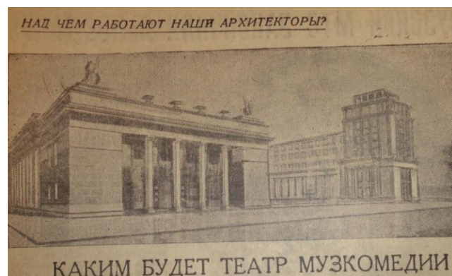
Из газеты «Рабочий край» от 17 декабря 1935 г.

В постановлении об образовании театра от 22 декабря 1934 г. [3, д. 433, л. 114–114 об.] шла речь и о выделении средств на мелкий ремонт этого театрального здания перед тем, как его займет труппа музыкальной комедии. А уже через год (декабрь 1935 г.) облисполком решил произвести реконструкцию здания: так, чтобы значительно увеличить вместимость зала. Причина была прозаична: «хозрасчетная единица» зарабатывала слишком мало денег. При имеющемся зрительном зале на 700 мест даже полные сборы расходов не покрывали [3, д. 3829, л. 13]. А т. к. бюджет областных театров формировался по формуле «хозрасчет + дотации из областного бюджета», то вторую составляющую очень хотелось сократить или, как минимум, не увеличивать.