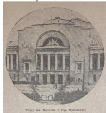
Здание театра им. Ф. Г. Волкова

Летом 1932 и 1933 гг. труппа работала летний сезон в Ярославле, на сцене театра имени Ф. Г. Волкова. Об этом свидетельствует раздел афиш и объявлений городской газеты «Северный рабочий», а также редкие рецензии. Напомним, Ярославль тогда входил в Ивановскую промышленную область, просуществовавшую до 1936 г.