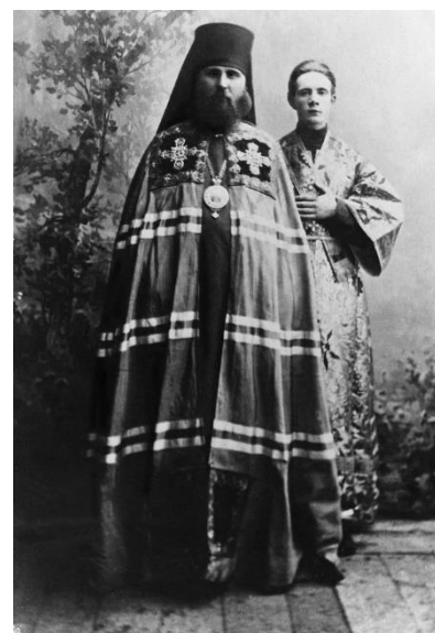
Архиепископ Иларион (Троицкий)