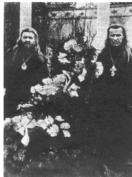
У могилы владыки Илариона

В Москве, с 8 по 9 апреля 1998 года состоялось заседание Священного Синода, председателем которого стал патриарх Московский Алексей II. На заседании было постановлено передать на Архиерейский Собор вопрос о канонизации архиепископа Илариона (Троицкого). По благословению митрополита Санкт-Петербургского и