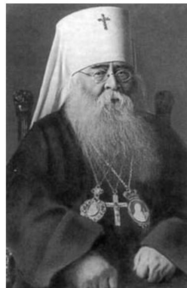
Митрополит Сергей (Страгородский)

Лидеры обновленчества предложили созвать Церковный собор летом 1923 года. Надеясь, что «живоцерковники» всё-таки принесут принародное покаяние в своих грехах перед Церковью, патриарх Тихон повелел вести переговоры с раскольниками, в частности, с обновленческим «митрополитом» Евдокимом (Мещерским). Православную же Церковь