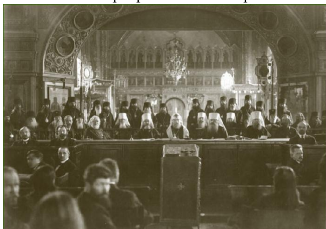
Поместный собор 1917 - 1918 гг.

Обращаясь к книге «Жизнеописание священномученика Илариона, архиепископа Вереяского», мы узнаём, что всю зиму 1918-1919 годов архимандрит Иларион посвятил лекциям в МДА, службам в церквях Москвы с