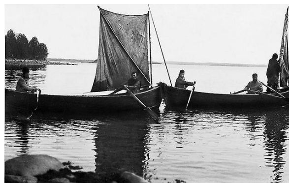
«Богословцы рыбаки показа...»

Владыка Иларион во время заключения выполнял самую разнообразную работу. Он был и лесником, и сторожем в Филипповой пустыни, и сетевязальщиком на Филимоновой рыболовной тоне в 10-ти километрах от Соловецкого лагеря. Многим известна его перефразировка стихир на Троицу: «Вся подаёт Дух Святой: прежде рыбаки богословцы показа, а теперь наоборот – богословцы рыбаки показа».