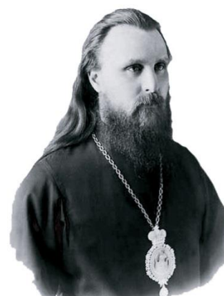
Епископ Иларион (Троицкий)

В 1920 году 11 (24) мая в храме Троицкого патриаршего подворья архимандрит Иларион был наречён епископом. После наречения он, обращаясь к патриарху Тихону и архиереям, прежде всего воздал хвалу Господу за то, что родители воспитали его христианином, сыном Церкви, за то, что многие из его предков посвятили себя Богу. Всё обращение Илариона было полно благодарности Создателю: «Слава Богу за и то, что пережито и передумано за эти последние годы бури и смятения... Что мы знали из церковной истории, о чём читали у