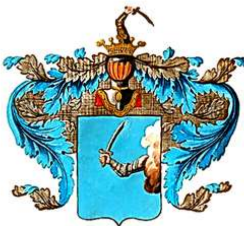
Рисунок 1. Герб рода Бахметьевых

1 сентября русские войска под руководством князей Юрия Васильевича (1441-1473) и Андрея Васильевича Большого (1446-1493) подошли к Казани, и был заключен мир. Это был первый крупный русский внешнеполитический успех. [3, Л.94] Третий этап активных выездов татар на Русь начался в правление Василия II Темного (1425-1462). Аслам (Ослам) Бахмет прибыл в Москву 1469 г. вместе со своими родственниками - царевичами Касимом и Ягуном Бахметами и принял крещение с именем Иеремии. У Аслана Бахмета было три сына: Иван, Кузьма и Петр по прозвищу Дунил, от него пошел род Дуниловых. В Дворянскую Родословную Книгу Ярославской губернии VI часть, внесено потомство Петра-Кудая Дунилова, жившего в XVI в.: Семен Александрович Дунилов подписал грамоту на избрание на Царство Михаила Федоровича в 1613 г, жилец Петр Андреевич владел помещьем в Каширском уезде в 1677 г; а Михаил Иванович принял участие в Чигиринском походе в 1678 г. [4, Л.311]