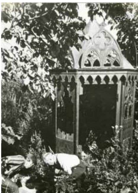
Рис. 5. Склеп Головниных