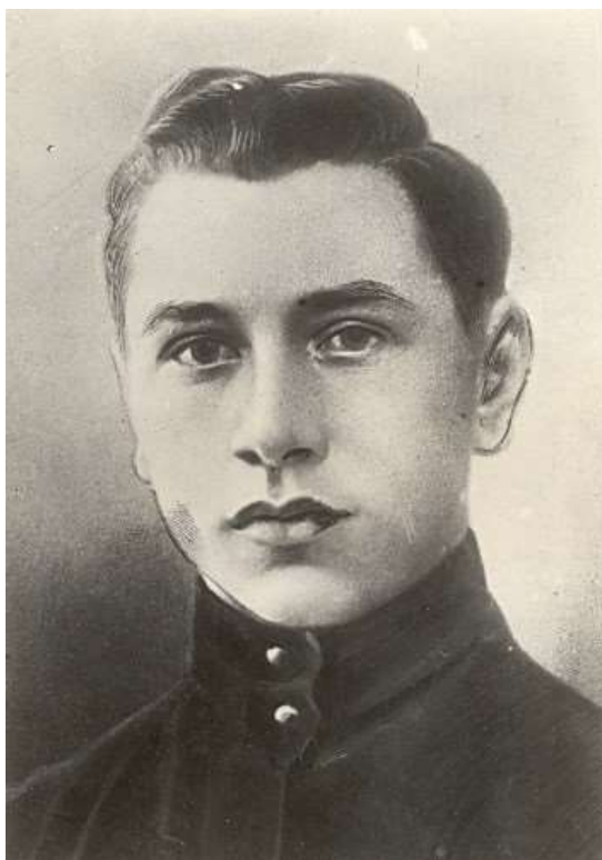
Рис.1. Портрет Н.А. Руднева. Фотография ч/б. 1917 г. ГУ ГАТО. Нефондовая организация фотодокументов. П-4491. Оп. 7, т. 5.

В 2023 и 2024 гг. в календаре памятных дат РФ отмечены две значимые годовщины – 105 лет со дня трагической гибели и 130 лет со дня рождения революционера и героя Гражданской войны Николая Александровича Руднева (Рис.1).