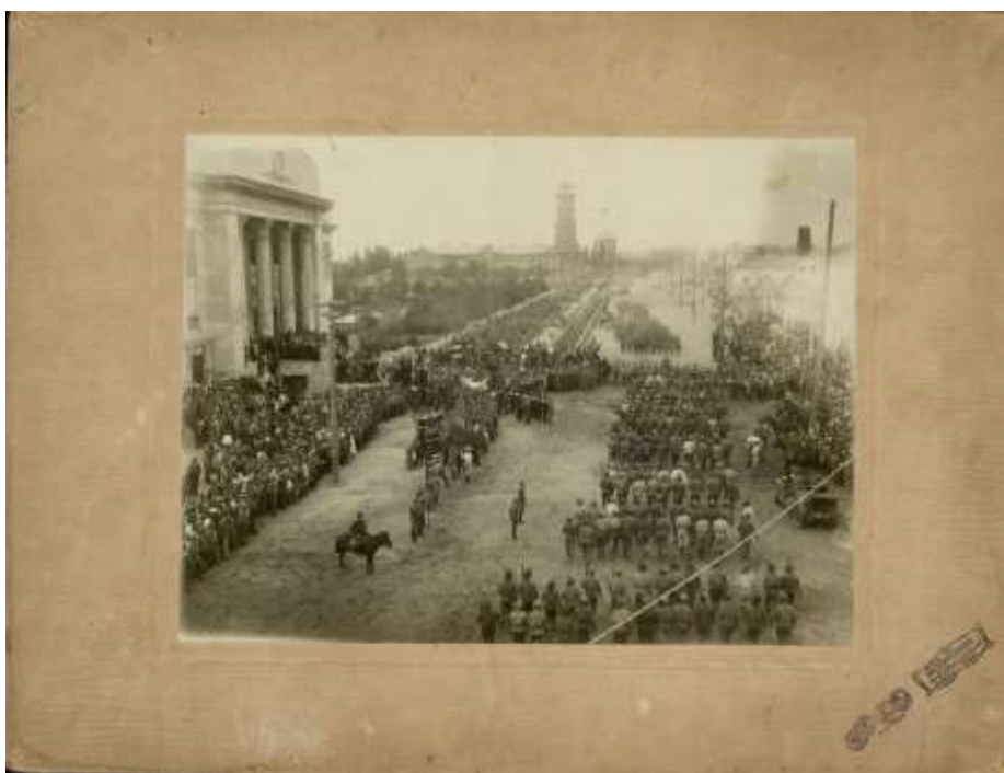
Рис. 6. Траурная процессия с гробом Н.А. Руднева в г. Царицыне. Фотография ч/б. 1918 г. ГУК ТО «Тульское музейное объединение». ГК 43630695.

Осенью 1918 г. к Царицыну почти со всех сторон начали подходить превосходящие силы противника. Самые ожесточенные бои разгорелись в районе Бекетовки. Одна из воинских частей красных перешла на сторону белоказаков, после чего противнику удалось захватить артбатарею и прорвать фронт. Чтобы закрыть образовавшуюся на участках 1-го и 2-го Крестьянских полков брешь, К.Е. Ворошилов приказал срочно подтянуть имевшуюся одну бригаду из новобранцев, которых Н.А. Руднев лично повел в контрнаступление. Умелое руководство, большой авторитет командира и его личный пример бесстрашия и самоотверженности в бою привели к перелому, положившему начало разгрому белогвардейских войск под Царицыном. Тяжело раненный Николай Руднев не покинул поле боя, пока не убедился, что прорыв ликвидирован, перелом обеспечен. К сожалению, принятые для спасения молодого командира меры успеха не имели. В ночь на 16 октября 1918 г. Н.А. Руднев скончался. В госпитале перед смертью герой успел сказать: «Передайте Ворошилову – приказ его выполнил. Напишите отцу – умер за революцию» [17]. «Вечно храбрый Коля», «лучший из лучших революционеров скончался» – так будут скорбеть о своем погибшем командире друзья в письмах к его родителям (РГАСПИ. Ф. 71. Оп. 35. Д. 1012. Л. 16-17). «Похороним и отомстим», «За тебя одного – тысячи их», «Смерть