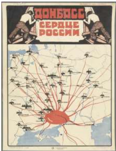
Рис. 4. Плакат «Донбасс - сердце России». 1921 г. ФГБУК «Государственный музей политической истории России». ГК 26789009.

«Он был везде, где была опасность, где был бой, - писал о Н.А. Рудневе его соратник Артем (Ф.А. Сергеев). Украина была одной из самых «горячих» точек в период