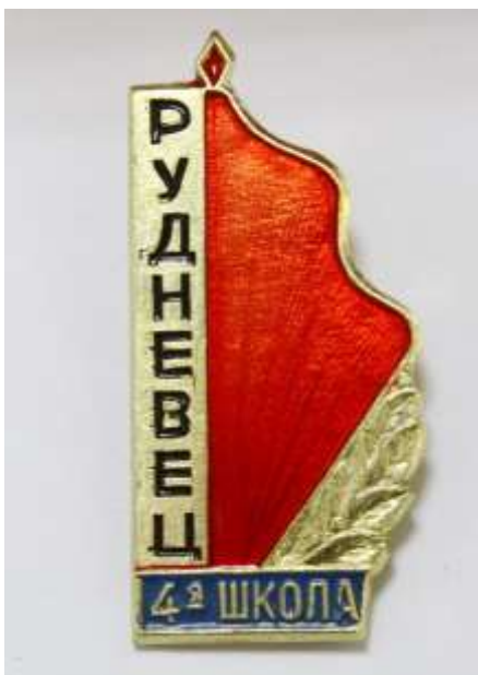
Рис. 7. Значок «Рудновец». 1970-е гг. ГУК ТО «Тульское музейное объединение». ГК 11121585.