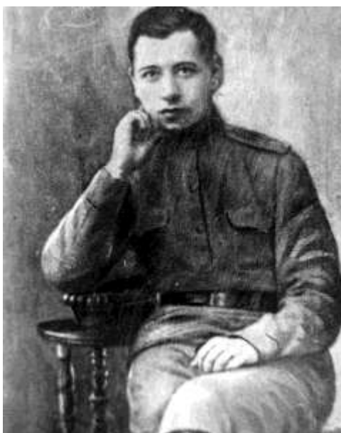
Рис. 5. Последняя прижизненная фотография Н.А. Руднева. Репродукция. 1984 г. ГУ ГАТО. Нефондовая организация фотодокументов. П-6047. Оп. 7. т. 7.

В июле-августе 1918 г. Н.А. Руднев возглавляет штаб войск, оборонявших подступы к Царицыну. К лету 1918 г. этот город приобрел огромное хозяйственно-политическое и военно-стратегическое значение. Через Царицын осуществлялась связь промышленных центров страны с богатыми хлебом, мясом, рыбой районами юго-востока. Этот рабочий город считался одним из основных революционных центров юго-востока европейской России. «Царицынский период» Н.А. Руднева представлен большим количеством документов официально-делового характера (приказы по военным делам Губернского комитета гор. Царицын (РГАСПИ. Ф. 71. Оп. 35. Д. 1012. Л. 33-36), ведомостью о количестве призванных (РГАСПИ. Ф. 71. Оп. 35. Д. 1012. Л. 77-78) и даже проектом использования на фронте калмыков авторства Н.А. Руднева (РГАСПИ. Ф. 71. Оп. 35. Д.