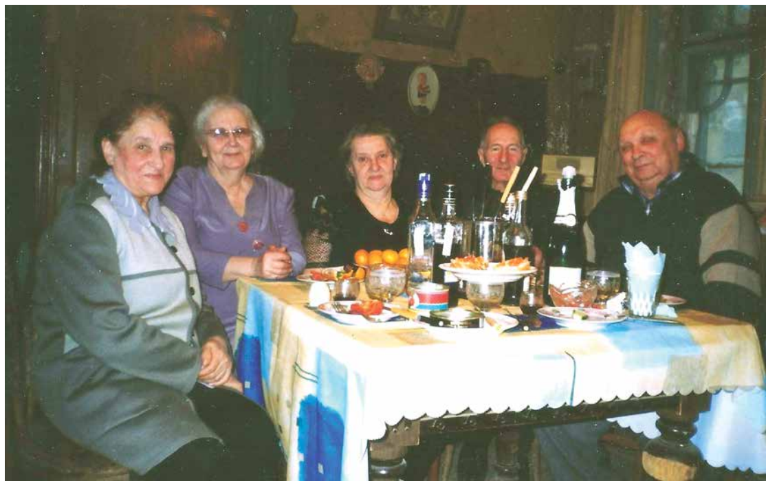
Встреча «под абажуром» в особняке на ул. Яблочкова, 2006 г.