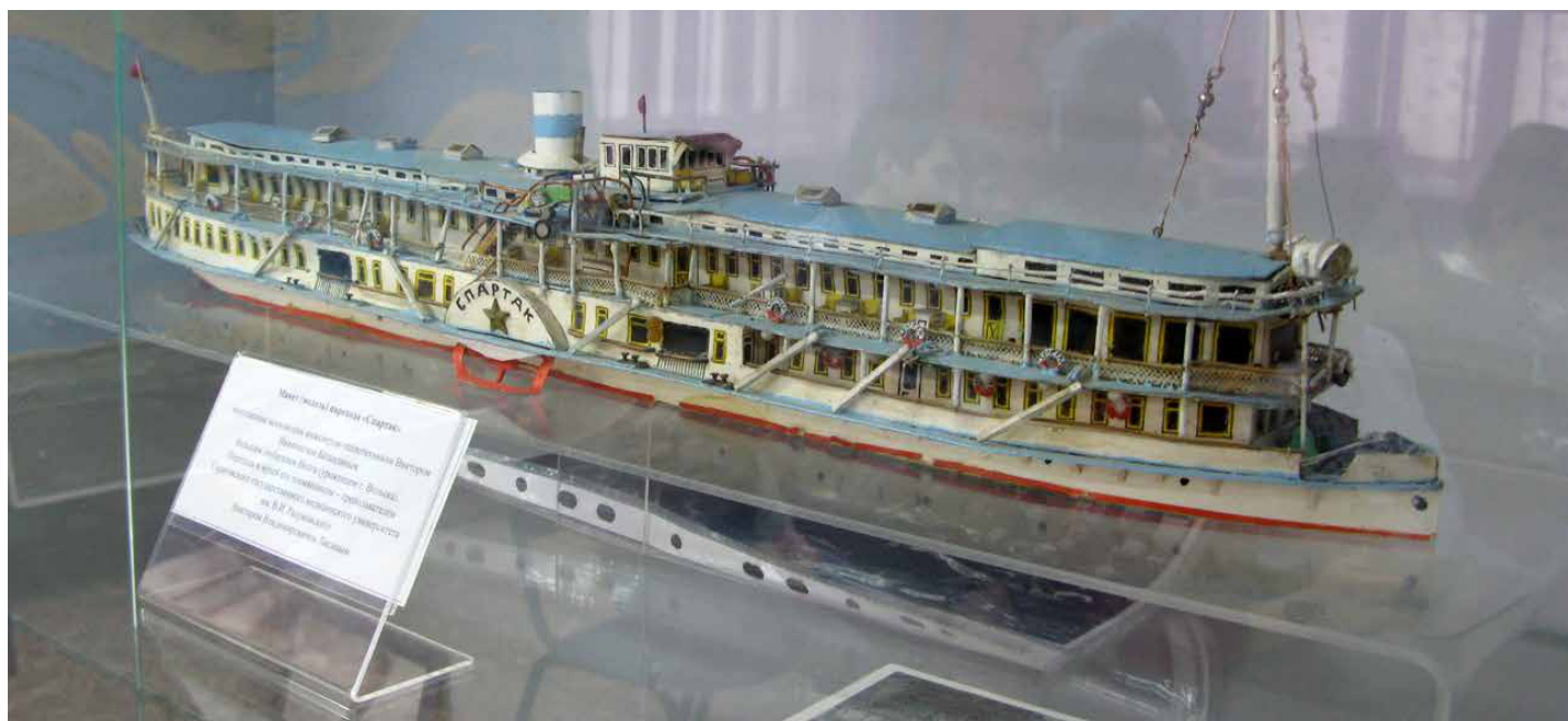
Модель парохода «Спартак»

на мои чтецкие выступления и просветительские вечера об актёрах и певцах в Доме работников искусств (Доме ученых).