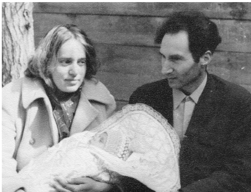
Семья Лисины, 1973 год